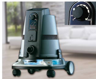
Élément de commande pour aspirateur de sol