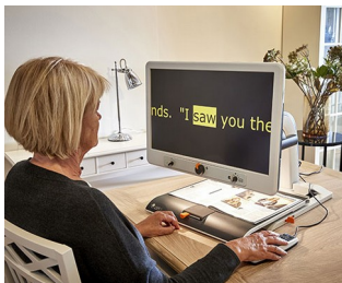
Boutons de commande pour téléagrandisseur