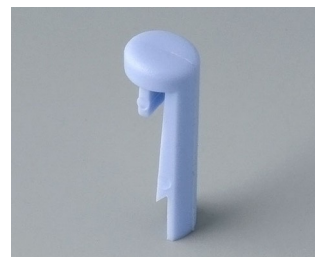
A1101006 Goupille PA 6 (UL 94 HB) ciel