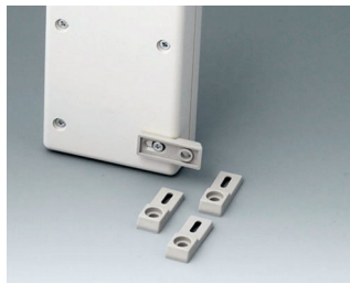
A9204108 Pattes de fixation PA 6 gris silex RAL 7032