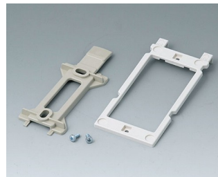
B1350048 Jeu de support mural ABS (UL 94 HB) gris silex RAL 7032