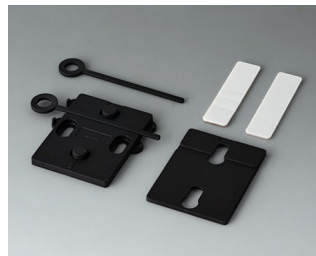
A9305019 Jeu de support mural ASA+PC (UL 94 V-0) noir RAL 9005