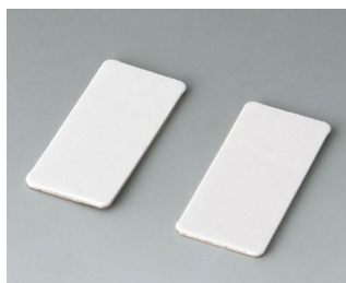
A9305147 Support pour pellicule adhésive

Sous réserve de modifications techniques. © OKW Gehäusesysteme, Buchen/Allemagne.