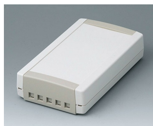
B1075465 TOPTEC 194 F, Vers. II ABS (UL 94 HB) gris blanc RAL 9002 194x115x46mm IP 40