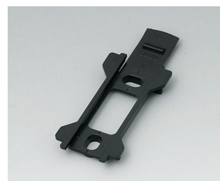
B1340029 Support mural pour Toptec 102 ABS (UL 94 HB) noir RAL 9005