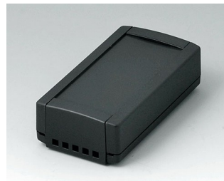
B1040469 TOPTEC 102, Vers. II ABS (UL 94 HB) noir RAL 9005 102x54x30mm IP 40