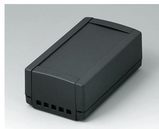
B1050469 TOPTEC 123 H, Vers. II ABS (UL 94 HB) noir RAL 9005 123x68x45mm IP 40