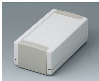
B1060365 TOPTEC 154 H, Vers. I ABS (UL 94 HB) gris blanc RAL 9002 154x84x56mm IP 40