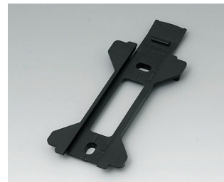
B1360029 Support mural pour Toptec 154 ABS (UL 94 HB) noir RAL 9005