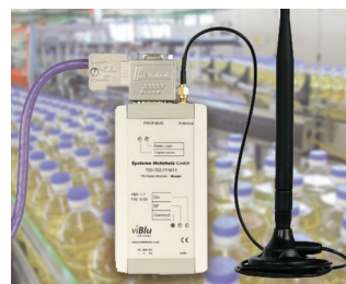
Le système radio PROFIBUS