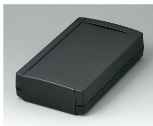
B1075369 TOPTEC 194 F, Vers. I ABS (UL 94 HB) noir RAL 9005 194x115x46mm IP 40