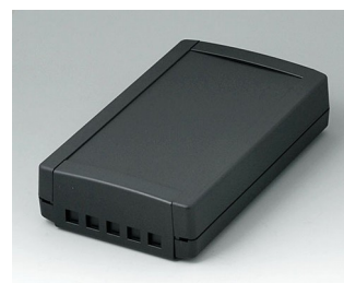
B1075469 TOPTEC 194 F, Vers. II ABS (UL 94 HB) noir RAL 9005 194x115x46mm IP 40