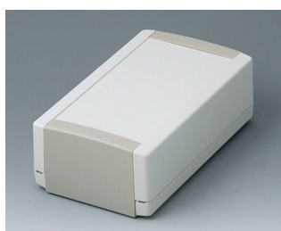
B1070365 TOPTEC 194 H, Vers. I ABS (UL 94 HB) gris blanc RAL 9002 194x115x68mm IP 40