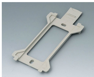
B1370028 Support mural pour Toptec 194 PC+ABS (UL 94 V-0) gris silex RAL 7032