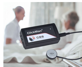
Multicôntroleur adaptatif pour capteurs simples