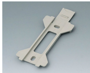
B1360028 Support mural pour Toptec 154 PC+ABS (UL 94 V-0) gris silex RAL 7032