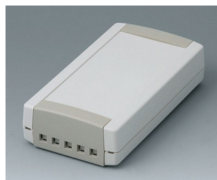
B1065465 TOPTEC 154 F, Vers. II ABS (UL 94 HB) gris blanc RAL 9002 154x84x38mm IP 40