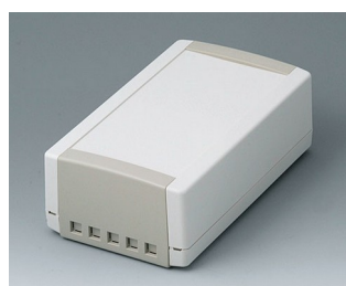
B1070465 TOPTEC 194 H, Vers. II ABS (UL 94 HB) gris blanc RAL 9002 194x115x68mm IP 40