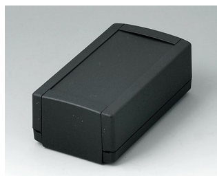
B1050369 TOPTEC 123 H, Vers. I ABS (UL 94 HB) noir RAL 9005 123x68x45mm IP 40