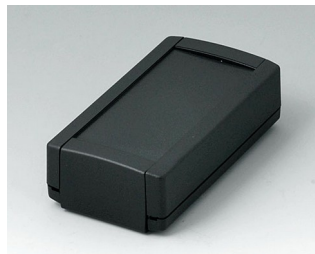
B1040369 TOPTEC 102, Vers. I ABS (UL 94 HB) noir RAL 9005 102x54x30mm IP 40