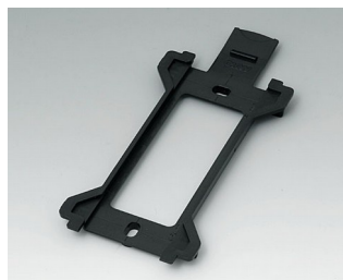
B1370029 Support mural pour Toptec 194 ABS (UL 94 HB) noir RAL 9005