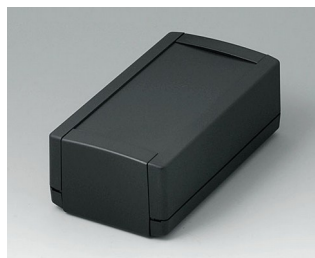
B1060369 TOPTEC 154 H, Vers. I ABS (UL 94 HB) noir RAL 9005 154x84x56mm IP 40