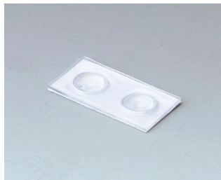
A9207150 Pieds anti-glissant 6,5 x 2 mm transparent

Sous réserve de modifications techniques. © OKW Gehäusesysteme, Buchen/Allemagne.