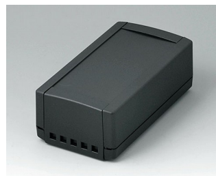
B1060469 TOPTEC 154 H, Vers. II ABS (UL 94 HB) noir RAL 9005 154x84x56mm IP 40