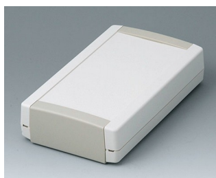
B1075365 TOPTEC 194 F, Vers. I ABS (UL 94 HB) gris blanc RAL 9002 194x115x46mm IP 40