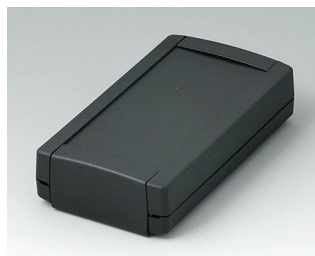
B1055369 TOPTEC 123 F, Vers. I ABS (UL 94 HB) noir RAL 9005 123x68x30mm IP 40