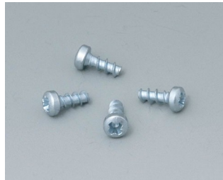
A9199008 Jeu de vis