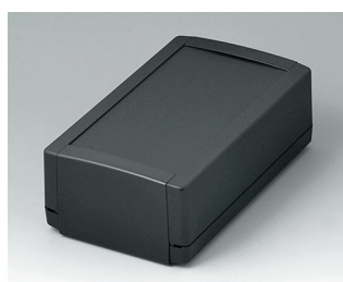
B1070369 TOPTEC 194 H, Vers. I ABS (UL 94 HB) noir RAL 9005 194x115x68mm IP 40