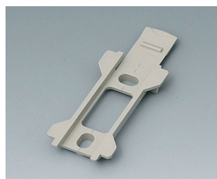
B1340028 Support mural pour Toptec 102 PC+ABS (UL 94 V-0) gris silex RAL 7032