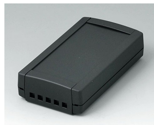
B1055469 TOPTEC 123 F, Vers. II ABS (UL 94 HB) noir RAL 9005 123x68x30mm IP 40