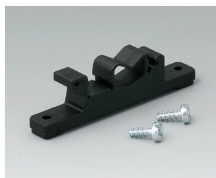
B1300019 Fixation pour barrettes DIN PA 6 noir RAL 9005