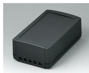
B1070469 TOPTEC 194 H, Vers. II ABS (UL 94 HB) noir RAL 9005 194x115x68mm IP 40