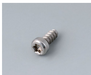
A0325060 Vis autotaraudeuse 2,5 x 6 mm (T8) Acier inoxydable