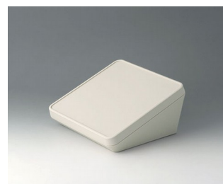
B4418107 PROTEC 180, Vers. I ASA+PC (UL 94 V-0) gris blanc RAL 9002 180x180x92mm IP 65 opt.