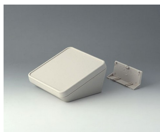
B4414207 PROTEC 140, Vers. II ASA+PC (UL 94 V-0) gris blanc RAL 9002 140x140x76mm IP 65 opt.