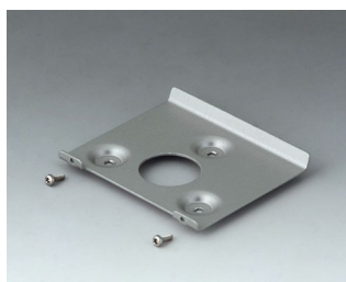
B4514101 Support mural 140 Aluminium