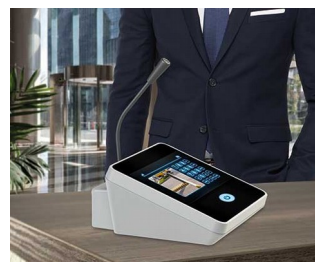
Microphone de table / interphone