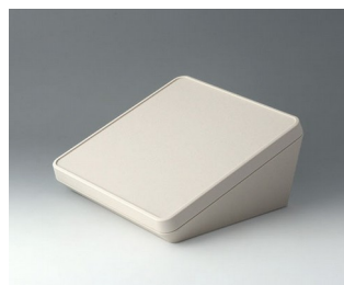
B4422107 PROTEC 220, Vers. I ASA+PC (UL 94 V-0) gris blanc RAL 9002 220x220x108mm IP 65 opt.