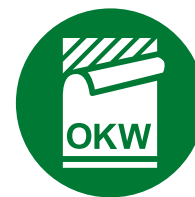
Étiquette, Films de décoration graphique