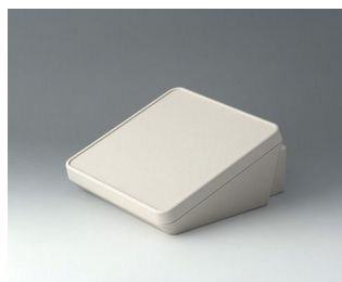
B4418307 PROTEC 180, Vers. III ASA+PC (UL 94 V-0) gris blanc RAL 9002 180x201x92mm IP 65 opt.