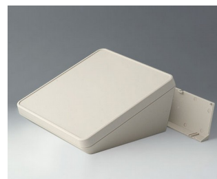
B4422207 PROTEC 220, Vers. II ASA+PC (UL 94 V-0) gris blanc RAL 9002 220x220x108mm IP 65 opt.