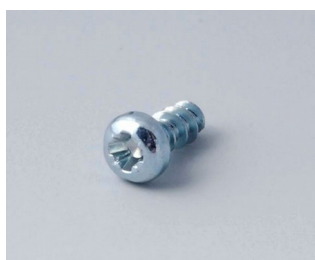
A0305031 Vis autotaraudeuses 2,5 x 6 mm (PZ1)