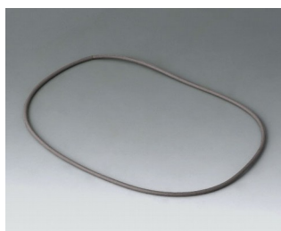
B4514030 Joint 140