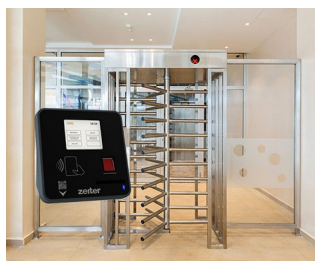
Terminal pour le contrôle d'accès