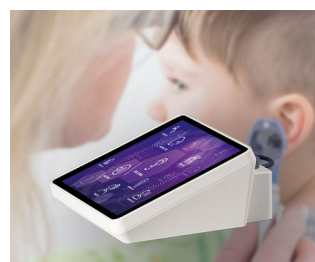
Appareil de test auditif