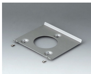
B4518101 Support mural 180 Aluminium