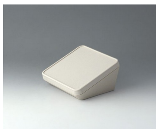
B4414107 PROTEC 140, Vers. I ASA+PC (UL 94 V-0) gris blanc RAL 9002 140x140x76mm IP 65 opt.