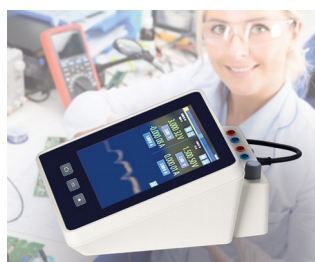
Appareil de mesure multimètre