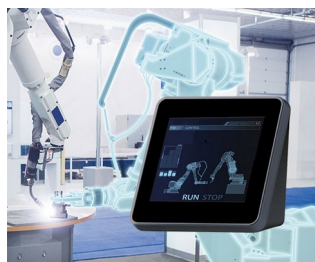
Contrôle des robots