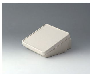
B4414307 PROTEC 140, Vers. III ASA+PC (UL 94 V-0) gris blanc RAL 9002 140x160x76mm IP 65 opt.