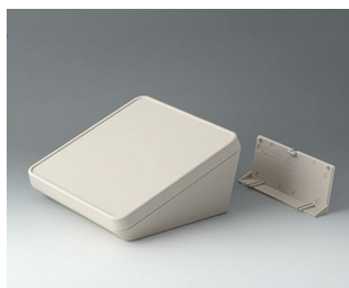
B4418207 PROTEC 180, Vers. II ASA+PC (UL 94 V-0) gris blanc RAL 9002 180x180x92mm IP 65 opt.