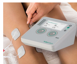
Compteur de biofeedback