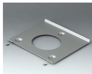
B4522101 Support mural 220 Aluminium