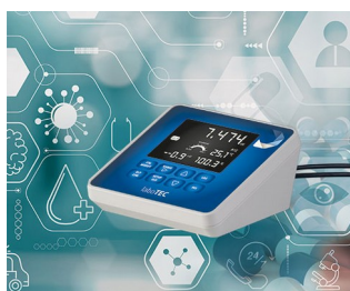
Appareil de mesure de laboratoire