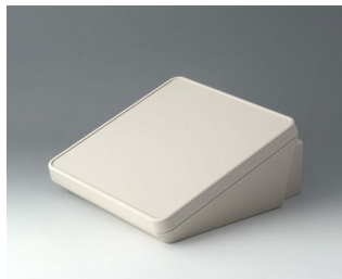
B4422307 PROTEC 220, Vers. III ASA+PC (UL 94 V-0) gris blanc RAL 9002 220x243x108mm IP 65 opt.