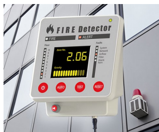
Terminal pour systèmes d'alarme incendie