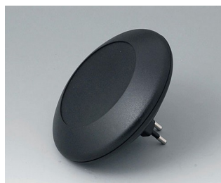
B5011029 ART-CASE R110 F PC+ABS (UL 94 V-0) noir RAL 9005 ø110x30mm IP 40