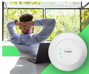
Feu de signalisation CO2 à capteur