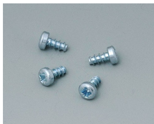
B5111201 Jeu de vis