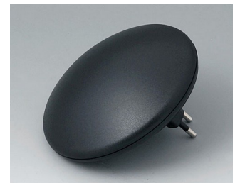
B5011329 ART-CASE R110 H PC+ABS (UL 94 V-0) noir RAL 9005 ø110x41mm IP 40