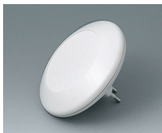
B5011027 ART-CASE R110 F PC+ABS (UL 94 V-0) gris blanc RAL 9002 ø110x30mm IP 40