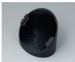
B5011319 Socle 55° ABS (UL 94 HB) noir RAL 9005