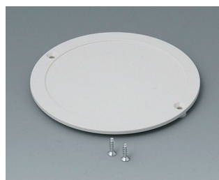
B5011847 Couvercle ABS (UL 94 HB) gris blanc RAL 9002