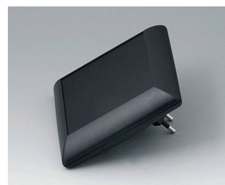
B5013229 ART-CASE S110 F PC+ABS (UL 94 V-0) noir RAL 9005 110x110x38mm IP 40