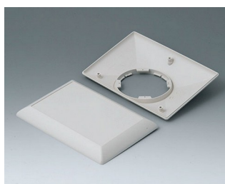
B5017207 Partie inférieure et supérieure E160 F ABS (UL 94 HB) gris blanc RAL 9002 160x110x38mm