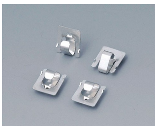
A9166001 Contacts à fiches, 2 x AAA Acier étamé