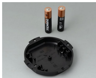
B5111109 Logement de pile, 2 x AAA ABS (UL 94 HB) noir RAL 9005