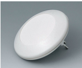
B5011227 ART-CASE R110 F PC+ABS (UL 94 V-0) gris blanc RAL 9002 ø110x38mm IP 40