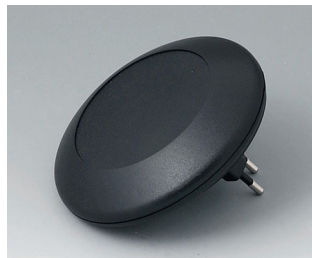
B5011229 ART-CASE R110 F PC+ABS (UL 94 V-0) noir RAL 9005 ø110x38mm IP 40