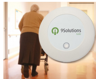
Gestion et contrôle d'accès