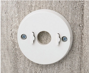
B5111307 Jeu de support mural ABS (UL 94 HB) gris blanc RAL 9002