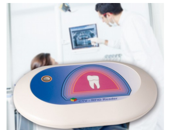
Lecteur RFID pour système CTV