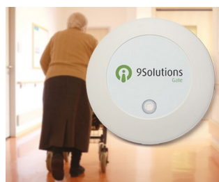
Gestion et contrôle d'accès