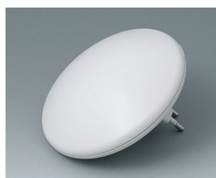
B5011327 ART-CASE R110 H PC+ABS (UL 94 V-0) gris blanc RAL 9002 ø110x41mm IP 40