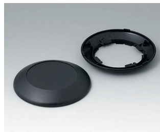
B5010009 Partie inférieure et supérieure R110 F ABS (UL 94 HB) noir RAL 9005 ø110x30mm