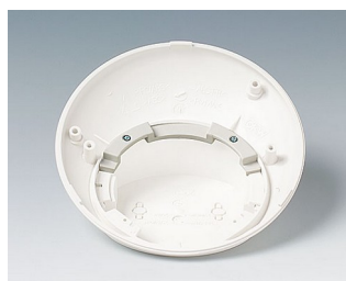
B5111707 Protection antitorsion ABS (UL 94 HB) gris blanc RAL 9002