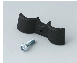
A9166003 Support de pile, 2 x AAA PA 6 (UL 94 HB) noir RAL 9005