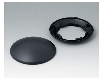
B5010109 Partie inférieure et supérieure R110 H ABS (UL 94 HB) noir RAL 9005 ø110x38mm