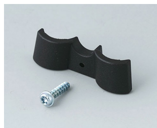
A9166003 Support de pile, 2 x AAA PA 6 (UL 94 HB) noir RAL 9005