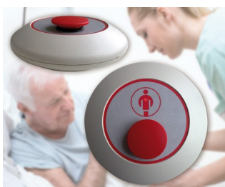
Bouton d'appel radio (coup-de-poing)