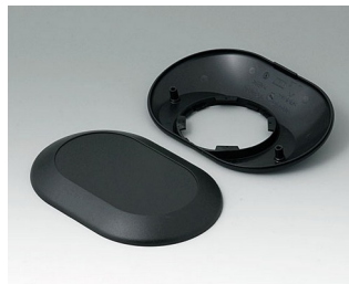
B5015209 Partie inférieure et supérieure O160 F ABS (UL 94 HB) noir RAL 9005 160x110x38mm