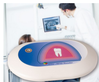
Lecteur RFID pour système CTV