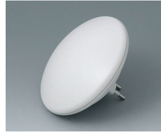
B5011127 ART-CASE R110 H PC+ABS (UL 94 V-0) gris blanc RAL 9002 ø110x38mm IP 40