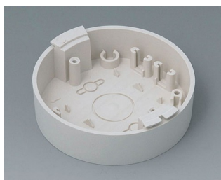
B5011117 Socle ABS (UL 94 HB) gris blanc RAL 9002