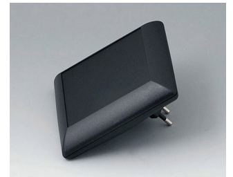
B5013229 ART-CASE S110 F PC+ABS (UL 94 V-0) noir RAL 9005 110x110x38mm IP 40