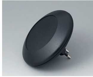
B5011029 ART-CASE R110 F PC+ABS (UL 94 V-0) noir RAL 9005 ø110x30mm IP 40