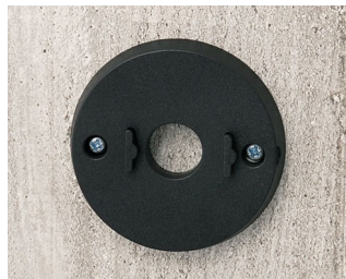
B5111309 Jeu de support mural ABS (UL 94 HB) noir RAL 9005