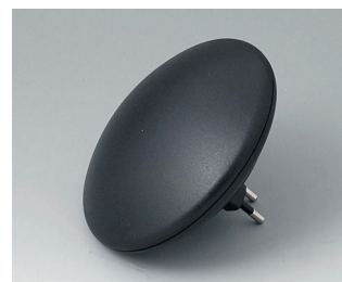
B5011129 ART-CASE R110 H PC+ABS (UL 94 V-0) noir RAL 9005 ø110x38mm IP 40