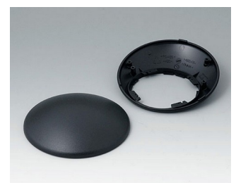
B5010309 Partie inférieure et supérieure R110 H ABS (UL 94 HB) noir RAL 9005 ø110x41mm