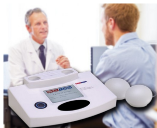
Système multiple d'analyse de résonances