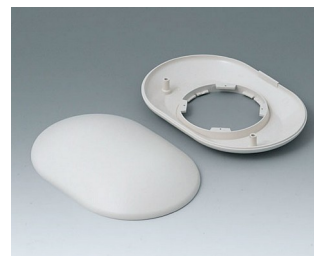
B5015107 Partie inférieure et supérieure O160 H ABS (UL 94 HB) gris blanc RAL 9002 160x110x38mm