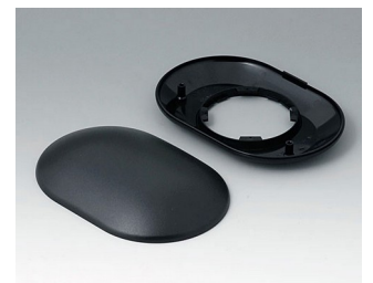
B5015109 Partie inférieure et supérieure O160 H ABS (UL 94 HB) noir RAL 9005 160x110x38mm