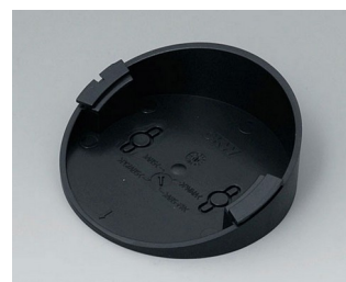
B5011219 Socle 30° ABS (UL 94 HB) noir RAL 9005