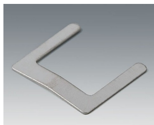
A9166002 Ressorts de contact, 2 x AAA Acier étamé