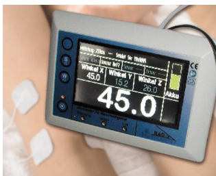
Mesure d'angle en 3D de systèmes d'articulations sur la base de la gravité