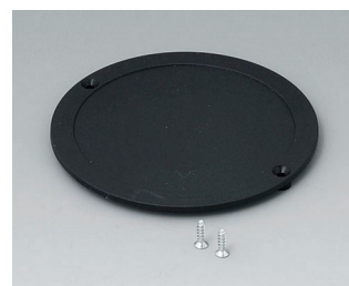
B5011849 Couvercle ABS (UL 94 HB) noir RAL 9005