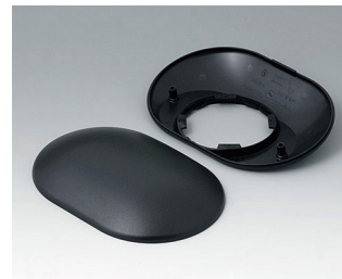
B5015309 Partie inférieure et supérieure O160 H ABS (UL 94 HB) noir RAL 9005 160x110x41mm