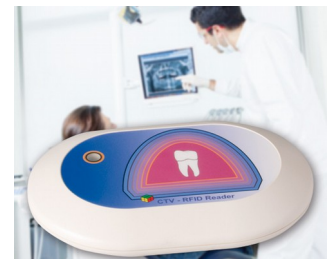
Lecteur RFID pour système CTV