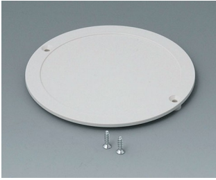
B5011857 Couverture du compartiment piles ABS (UL 94 HB) gris blanc RAL 9002