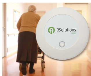
Gestion et contrôle d'accès