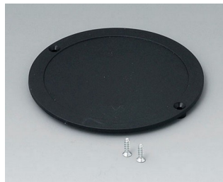
B5011859 Couverture du compartiment piles ABS (UL 94 HB) noir RAL 9005