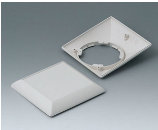
B5012207 Partie inférieure et supérieure S110 F ABS (UL 94 HB) gris blanc RAL 9002 110x110x38mm