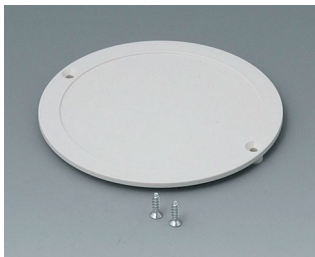
B5011857 Couverture du compartiment piles ABS (UL 94 HB) gris blanc RAL 9002