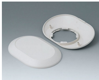
B5015207 Partie inférieure et supérieure O160 F ABS (UL 94 HB) gris blanc RAL 9002 160x110x38mm