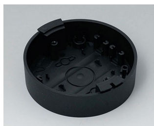
B5011119 Socle ABS (UL 94 HB) noir RAL 9005