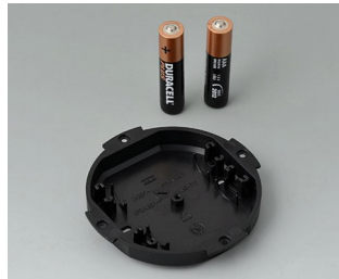
B5111109 Logement de pile, 2 x AAA ABS (UL 94 HB) noir RAL 9005