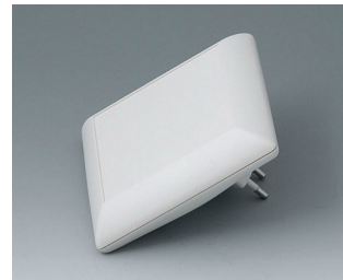
B5013227 ART-CASE S110 F PC+ABS (UL 94 V-0) gris blanc RAL 9002 110x110x38mm IP 40