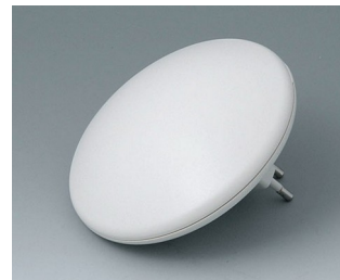
B5011327 ART-CASE R110 H PC+ABS (UL 94 V-0) gris blanc RAL 9002 ø110x41mm IP 40