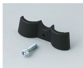
A9166003 Support de pile, 2 x AAA PA 6 (UL 94 HB) noir RAL 9005