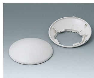
B5010307 Partie inférieure et supérieure R110 H ABS (UL 94 HB) gris blanc RAL 9002 ø110x41mm