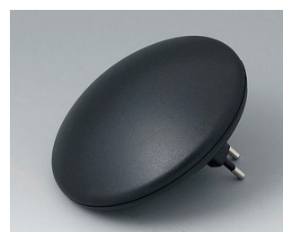
B5011329 ART-CASE R110 H PC+ABS (UL 94 V-0) noir RAL 9005 ø110x41mm IP 40