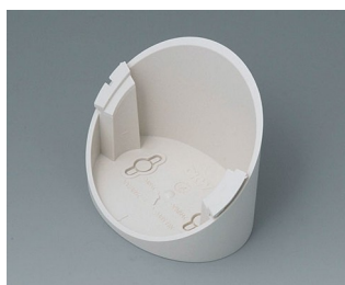
B5011317 Socle 55° ABS (UL 94 HB) gris blanc RAL 9002