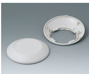
B5010207 Partie inférieure et supérieure R110 F ABS (UL 94 HB) gris blanc RAL 9002 ø110x38mm