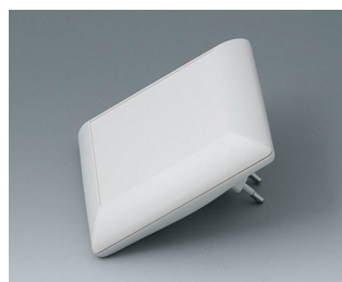
B5013227 ART-CASE S110 F PC+ABS (UL 94 V-0) gris blanc RAL 9002 110x110x38mm IP 40