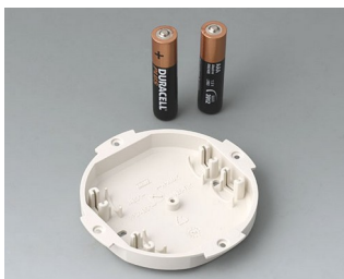
B5111107 Logement de pile, 2 x AAA ABS (UL 94 HB) gris blanc RAL 9002