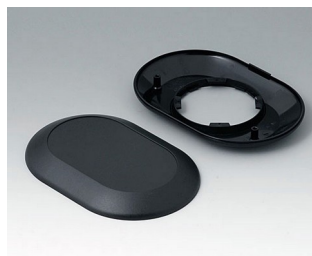
B5015009 Partie inférieure et supérieure O160 F ABS (UL 94 HB) noir RAL 9005 160x110x30mm