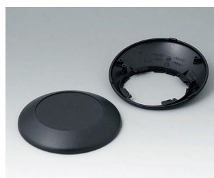
B5010209 Partie inférieure et supérieure R110 F ABS (UL 94 HB) noir RAL 9005 ø110x38mm