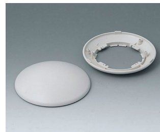
B5010107 Partie inférieure et supérieure R110 H ABS (UL 94 HB) gris blanc RAL 9002 ø110x38mm