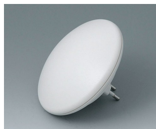
B5011127 ART-CASE R110 H PC+ABS (UL 94 V-0) gris blanc RAL 9002 ø110x38mm IP 40