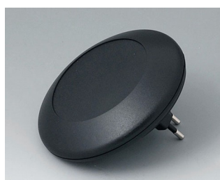
B5011229 ART-CASE R110 F PC+ABS (UL 94 V-0) noir RAL 9005 ø110x38mm IP 40