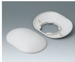
B5015307 Partie inférieure et supérieure O160 H ABS (UL 94 HB) gris blanc RAL 9002 160x110x41mm