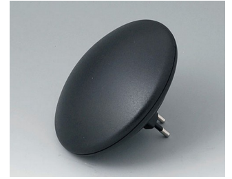
B5011129 ART-CASE R110 H PC+ABS (UL 94 V-0) noir RAL 9005 ø110x38mm IP 40