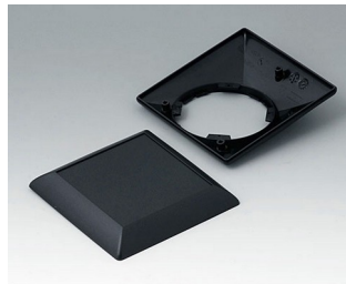
B5012209 Partie inférieure et supérieure S110 F ABS (UL 94 HB) noir RAL 9005 110x110x38mm