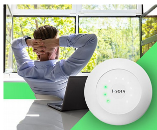
Feu de signalisation CO2 à capteur