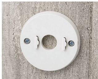
B5111307 Jeu de support mural ABS (UL 94 HB) gris blanc RAL 9002