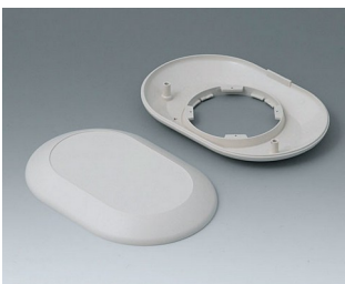
B5015007 Partie inférieure et supérieure O160 F ABS (UL 94 HB) gris blanc RAL 9002 160x110x30mm