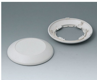
B5010007 Partie inférieure et supérieure R110 F ABS (UL 94 HB) gris blanc RAL 9002 ø110x30mm