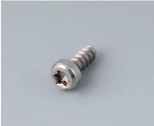
A0325060 Vis autotaraudeuse 2,5 x 6 mm (T8) Acier inoxydable