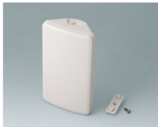
B4608107 SMART-CONTROL S, Vers. I ASA+PC (UL 94 V-0) gris blanc RAL 9002 142x81x46mm IP 55 opt., IP 40