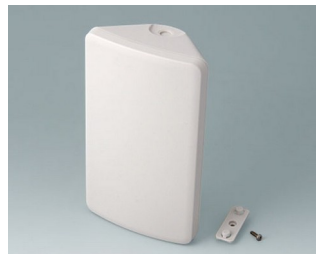
B4610107 SMART-CONTROL M, Vers. I ASA+PC (UL 94 V-0) gris blanc RAL 9002 173x101x59mm IP 55 opt., IP 40