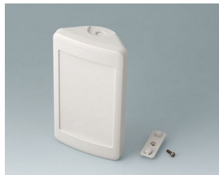
B4608207 SMART-CONTROL S, Vers. II ASA+PC (UL 94 V-0) gris blanc RAL 9002 142x81x46mm IP 55 opt., IP 40