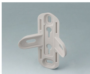
B4705907 Support mural ASA+PC (UL 94 V-0)