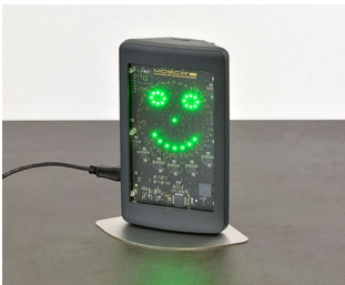
Appareil de mesure de l'air intérieur