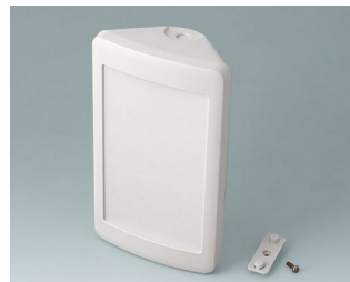
B4610207 SMART-CONTROL M, Vers. II ASA+PC (UL 94 V-0) gris blanc RAL 9002 173x101x59mm IP 55 opt., IP 40