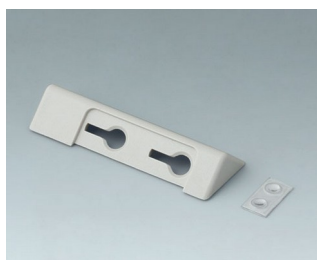
B4705207 Kit support de table ASA+PC (UL 94 V-0)