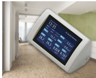
Appareil de mesure des aérosols