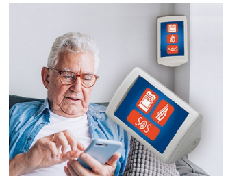
Système d'assistance AAL