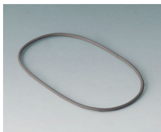
B4708920 Joint S