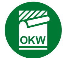
Étiquette, Films de décoration graphique