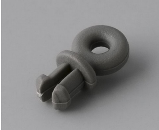
A9100001 Anneau PA 6 volcan