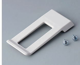
A9172107 Clip de poche ABS (UL 94 HB) gris blanc RAL 9002 62x30mm