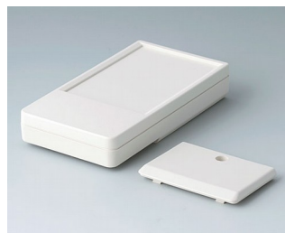
A9072117 DATEC-POCKET-BOX L ABS (UL 94 HB) gris blanc RAL 9002 120x65x22mm IP 54