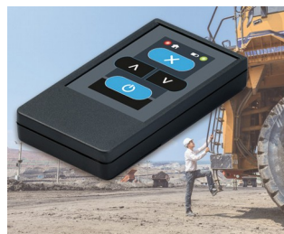
Émetteur radio pour machines