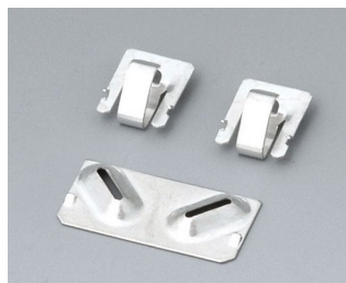
A9190002 Ressorts de contact, 2xN/2xAA/2xAAA Acier étamé