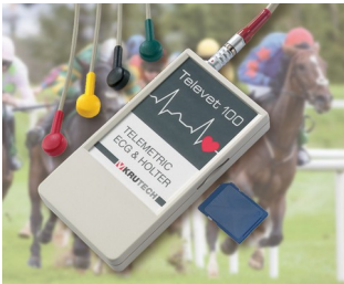
Système télémétrique ECG pour la médecine vétérinaire