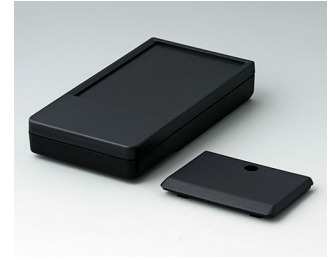
A9072219 DATEC-POCKET-BOX L PMMA (IR) (UL 94 HB) noir RAL 9005 120x65x22mm IP 54