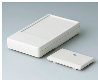
A9071117 DATEC-POCKET-BOX M ABS (UL 94 HB) gris blanc RAL 9002 105x58x18,5mm IP 54