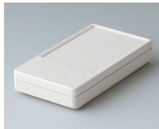
A9070117 DATEC-POCKET-BOX S ABS (UL 94 HB) gris blanc RAL 9002 85x46x16mm IP 54