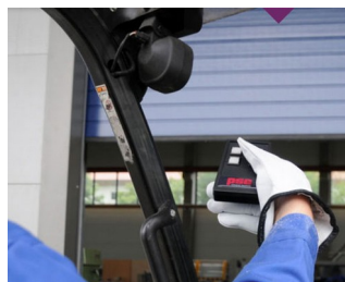
Télécommande IR pour environnements rudes