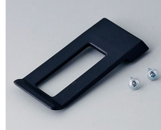
A9172109 Clip de poche ABS (UL 94 HB) noir RAL 9005 62x30mm