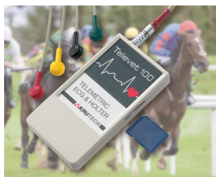
Système télémétrique ECG pour la médecine vétérinaire