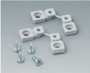
C2299028 Pattes de fixation PA 6 (UL 94 HB) gris clair RAL 7035