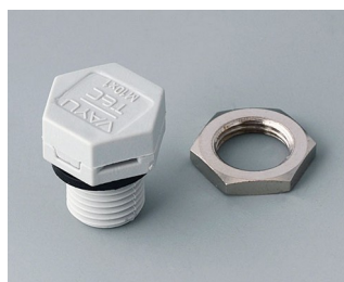
C2310917 Élément à compensation de pression M10x1 PA 6 (UL 94 HB) gris clair RAL 7035 IP 56