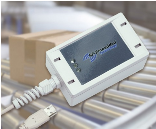
Lecteur UHF robuste