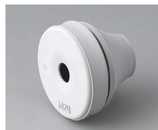
C2320137 Passe-câble EPDM gris clair RAL 7035 IP 67