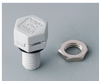
C2306917 Élément à compensation de pression M6x0,75 PA 6 (UL 94 HB) gris clair RAL 7035 IP 56