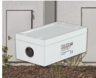
Verrouillage de porte électromécanique