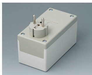
A9021665 BOITIER PRISE F / D, Vers. I PC+ABS (UL 94 V-0) gris silex RAL 7032 120x65x65mm