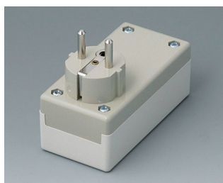
A9011665 BOITIER PRISE F / D, Vers. I PC+ABS (UL 94 V-0) gris blanc RAL 9002 100x50x40mm