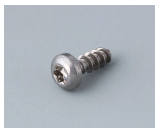
A0308132 Vis autotaraudeuse 3 x 8 mm (T10) Acier inoxydable

Sous réserve de modifications techniques.