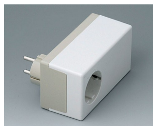
A9022465 BOITIER PRISE D, Vers. II PC+ABS (UL 94 V-0) gris silex RAL 7032 120x65x55mm