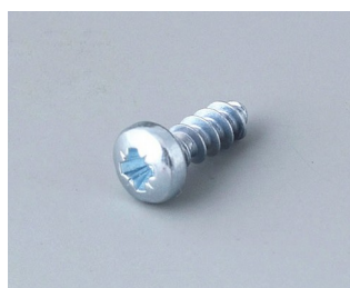
A0308031 Vis autotaraudeuses 3 x 8 mm (PZ1)