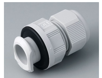
C2320717 Passe-câble à vis, M20, quick fix PA gris clair RAL 7035