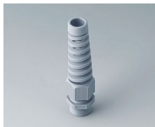
C2320518 Passe-câble à vis M20x1,5 PA gris argent RAL 7001