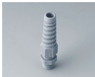
C2312518 Passe-câble à vis M12x1,5 PA gris argent RAL 7001