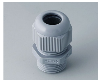
C2320418 Passe-câble à vis M20x1,5 PA gris argent RAL 7001