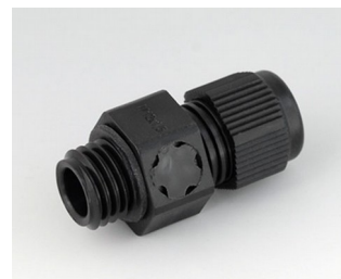
C2312919 Passe-câble à vis M12x1,5, compensation de pression PA noir RAL 9005