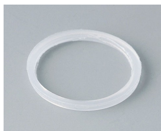
C2320126 Joint d'étanchéité M20x1,5 PE teinte neutre

Sous réserve de modifications techniques. © OKW Gehäusesysteme, Buchen/Allemagne.