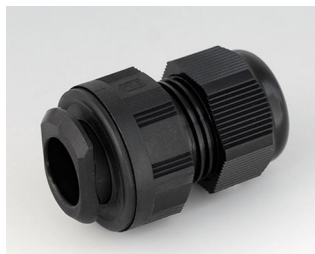
C2320719 Passe-câble à vis, M20, quick fix PA noir RAL 9005 IP 68