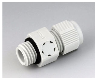
C2312917 Passe-câble à vis M12x1,5, compensation de pression PA gris clair RAL 7035