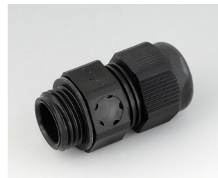
C2316919 Passe-câble à vis M16x1,5, compensation de pression PA noir RAL 9005