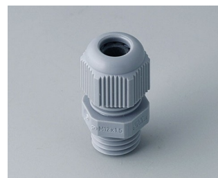
C2312418 Passe-câble à vis M12x1,5 PA gris argent RAL 7001