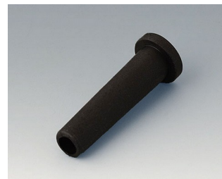
C2353849 Passe-câble souple Ø 5.3 noir