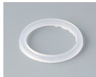
C2316126 Joint d'étanchéité M16x1,5 PE teinte neutre