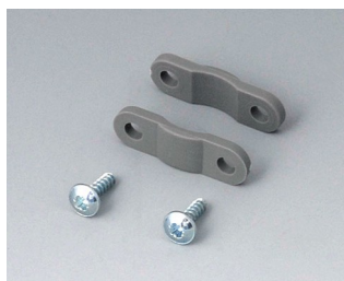
A9166004 Jeu de décharge de traction PA 6 volcan