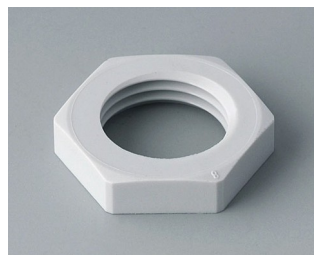
C2316117 Contre-écrou M16x1,5 PA gris clair RAL 7035