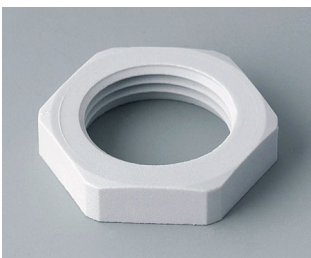
C2320117 Contre-écrou M20x1,5 PA gris clair RAL 7035