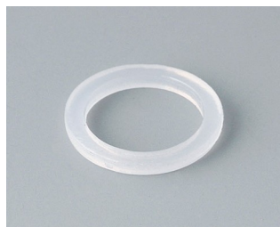
C2312126 Joint d'étanchéité M12x1,5 PE teinte neutre