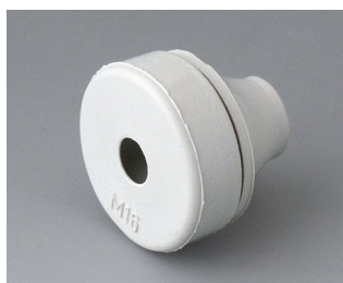
C2316137 Passe-câble EPDM gris clair RAL 7035