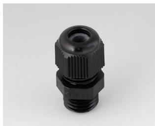
C2312419 Passe-câble à vis M12x1,5 PA noir RAL 9005