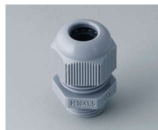
C2316418 Passe-câble à vis M16x1,5 PA gris argent RAL 7001