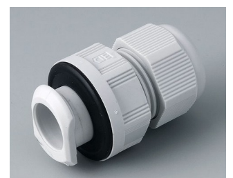
C2320717 Passe-câble à vis, M20, quick fix PA gris clair RAL 7035