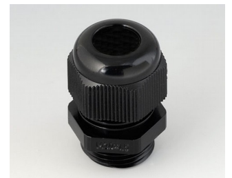
C2320419 Passe-câble à vis M20x1,5 PA noir RAL 9005