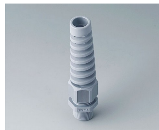
C2320528 Passe-câble à vis M20x1,5 PA gris argent RAL 7001