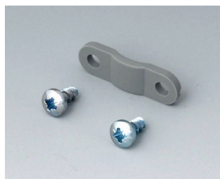
A9199005 Décharge de traction PA 6 volcan