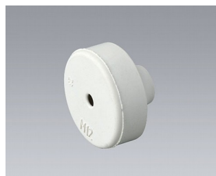
C2312137 Passe-câble EPDM gris clair RAL 7035