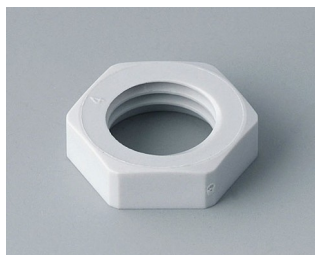
C2312117 Contre-écrou M12x1,5 PA gris clair RAL 7035