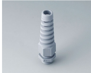
C2316518 Passe-câble à vis M16x1,5 PA gris argent RAL 7001