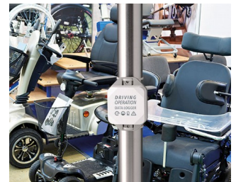
Enregistreur de données pour les opérations de conduite