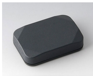
B1822118 MINI-DATA-BOX E40, plate ASA+PC (UL 94 V-0) gris anthracite RAL 7016 60x40x15mm IP 65 opt., IP 40