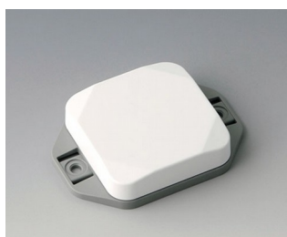
B1804126 MINI-DATA-BOX SF50, plate avec bride ASA+PC (UL 94 V-0) blanc signalisation RAL 9016 50x50x15mm IP 65 opt., IP 40