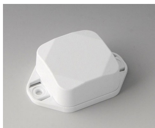
B1802227 MINI-DATA-BOX SF40, haute avec bride ASA+PC (UL 94 V-0) blanc signalisation RAL 9016 40x40x20mm IP 65 opt., IP 40