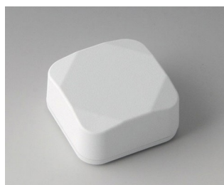
B1802217 MINI-DATA-BOX S40, haute ASA+PC (UL 94 V-0) blanc signalisation RAL 9016 40x40x20mm IP 65 opt., IP 40