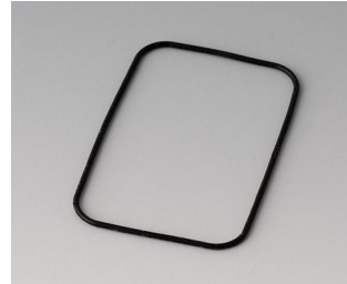
B1922101 Joint E40/EF40