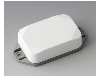
B1822226 MINI-DATA-BOX EF40, haute avec bride ASA+PC (UL 94 V-0) blanc signalisation RAL 9016 60x40x20mm IP 65 opt., IP 40