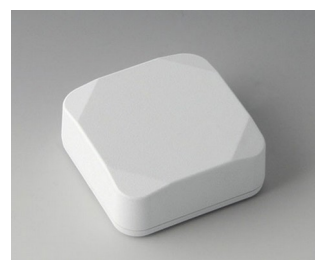
B1804217 MINI-DATA-BOX S50, haute ASA+PC (UL 94 V-0) blanc signalisation RAL 9016 50x50x20mm IP 65 opt., IP 40