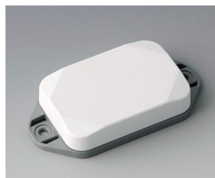
B1822126 MINI-DATA-BOX EF40, plate avec bride ASA+PC (UL 94 V-0) blanc signalisation RAL 9016 60x40x15mm IP 65 opt., IP 40