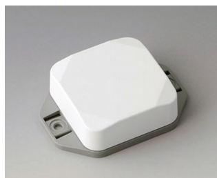
B1804226 MINI-DATA-BOX SF50, haute avec bride ASA+PC (UL 94 V-0) blanc signalisation RAL 9016 50x50x20mm IP 65 opt., IP 40