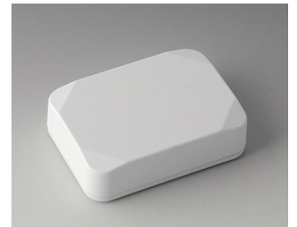
B1824217 MINI-DATA-BOX E50, haute ASA+PC (UL 94 V-0) blanc signalisation RAL 9016 70x50x20mm IP 65 opt., IP 40