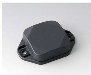
B1802128 MINI-DATA-BOX SF40, plate avec bride ASA+PC (UL 94 V-0) gris anthracite RAL 7016 40x40x15mm IP 65 opt., IP 40