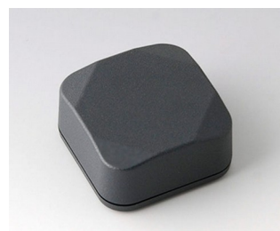
B1802218 MINI-DATA-BOX S40, haute ASA+PC (UL 94 V-0) gris anthracite RAL 7016 40x40x20mm IP 65 opt., IP 40