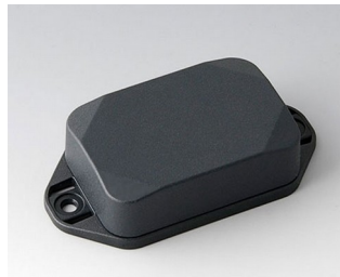
B1822228 MINI-DATA-BOX EF40, haute avec bride ASA+PC (UL 94 V-0) gris anthracite RAL 7016 60x40x20mm IP 65 opt., IP 40