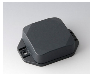
B1804228 MINI-DATA-BOX SF50, haute avec bride ASA+PC (UL 94 V-0) gris anthracite RAL 7016 50x50x20mm IP 65 opt., IP 40