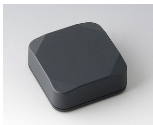
B1804218 MINI-DATA-BOX S50, haute ASA+PC (UL 94 V-0) gris anthracite RAL 7016 50x50x20mm IP 65 opt., IP 40