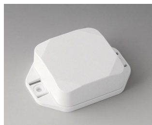
B1804227 MINI-DATA-BOX SF50, haute avec bride ASA+PC (UL 94 V-0) blanc signalisation RAL 9016 50x50x20mm IP 65 opt., IP 40