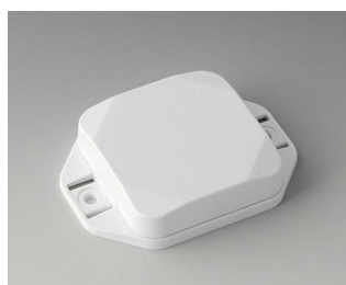
B1804127 MINI-DATA-BOX SF50, plate avec bride ASA+PC (UL 94 V-0) blanc signalisation RAL 9016 50x50x15mm IP 65 opt., IP 40