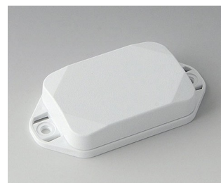
B1822127 MINI-DATA-BOX EF40, plate avec bride ASA+PC (UL 94 V-0) blanc signalisation RAL 9016 60x40x15mm IP 65 opt., IP 40