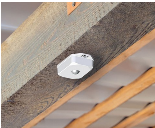
Détecteur de mouvement avec capteur pour contrôle automatique