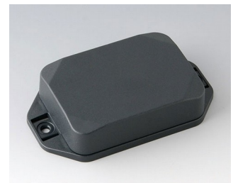
B1824228 MINI-DATA-BOX EF50, haute avec bride ASA+PC (UL 94 V-0) gris anthracite RAL 7016 70x50x20mm IP 65 opt., IP 40