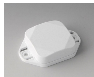
B1802127 MINI-DATA-BOX SF40, plate avec bride ASA+PC (UL 94 V-0) blanc signalisation RAL 9016 40x40x15mm IP 65 opt., IP 40