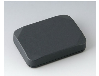
B1824118 MINI-DATA-BOX E50, plate ASA+PC (UL 94 V-0) gris anthracite RAL 7016 70x50x15mm IP 65 opt., IP 40