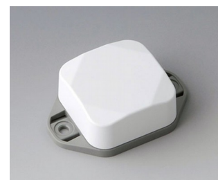
B1802226 MINI-DATA-BOX SF40, haute avec bride ASA+PC (UL 94 V-0) blanc signalisation RAL 9016 40x40x20mm IP 65 opt., IP 40