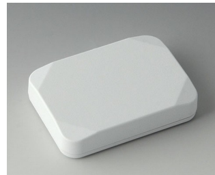
B1824117 MINI-DATA-BOX E50, plate ASA+PC (UL 94 V-0) blanc signalisation RAL 9016 70x50x15mm IP 65 opt., IP 40