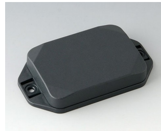
B1824128 MINI-DATA-BOX EF50, plate avec bride ASA+PC (UL 94 V-0) gris anthracite RAL 7016 70x50x15mm IP 65 opt., IP 40