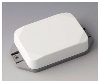
B1824226 MINI-DATA-BOX EF50, haute avec bride ASA+PC (UL 94 V-0) blanc signalisation RAL 9016 70x50x20mm IP 65 opt., IP 40