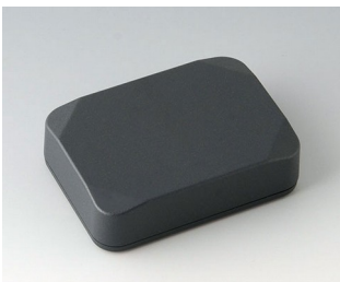
B1824218 MINI-DATA-BOX E50, haute ASA+PC (UL 94 V-0) gris anthracite RAL 7016 70x50x20mm IP 65 opt., IP 40