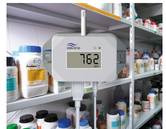
Détecteur de gaz pour substances dangereuses