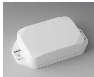
B1824227 MINI-DATA-BOX EF50, haute avec bride ASA+PC (UL 94 V-0) blanc signalisation RAL 9016 70x50x20mm IP 65 opt., IP 40