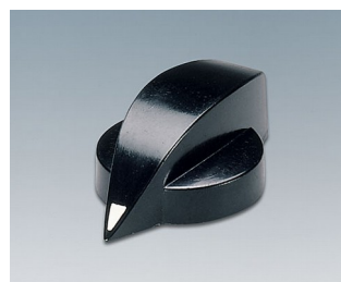
A1317860 BOUTON, à fixation latérale par vis PF (UL 94 V-0) noir RAL 9005 20,3x12,8mm 6mm