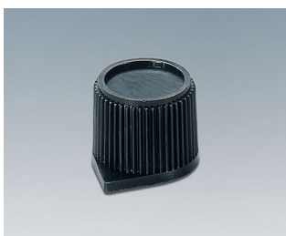
A1310560 BOUTON, à fixation latérale par vis PC noir RAL 9005 15,4x13,2mm 6mm