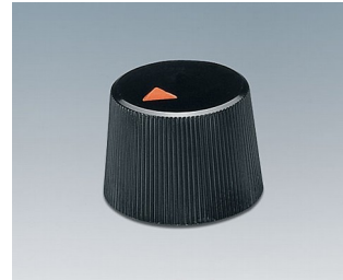
A1316240 BOUTON, à fixation latérale par vis ABS (UL 94 HB) noir RAL 9005 16,4x12,3mm 4mm