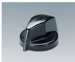
A1311860 BOUTON, à fixation latérale par vis PF (UL 94 V-0) noir RAL 9005 18,8x12,5mm 6mm