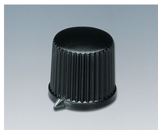
A1312560 BOUTON, à fixation latérale par vis ABS (UL 94 HB) noir RAL 9005 20,7x19,7mm 6mm