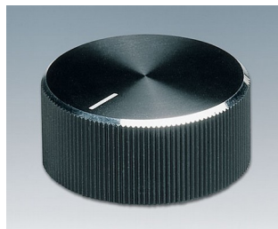
A1432260 BOUTON, à fixation latérale par vis ABS (UL 94 HB) noir/alu 33x14,3mm 6mm