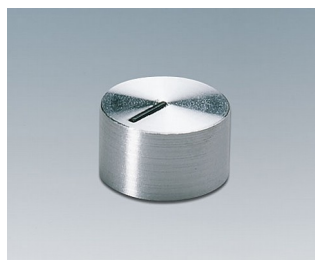
A1412441 BOUTON, à fixation latérale par vis PC brillant 12x7,2mm 4mm