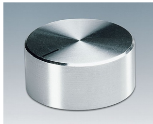
A1438461 BOUTON, à fixation latérale par vis ABS (UL 94 HB) brillant 37,8x15,9mm 6mm