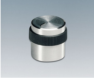
A1416469 BOUTON, à fixation latérale par vis ABS (UL 94 HB) brillant 15,9x15,2mm 6mm