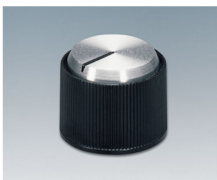
A1318260 BOUTON, à fixation latérale par vis ABS (UL 94 HB) noir/alu 18,2x14,2mm 6mm