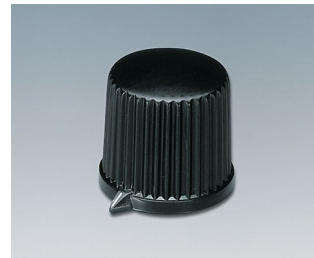
A1312560 BOUTON, à fixation latérale par vis ABS (UL 94 HB) noir RAL 9005 20,7x19,7mm 6mm