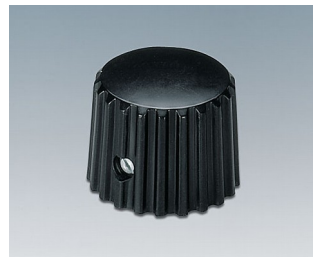
A1321160 BOUTON, à fixation latérale par vis ABS (UL 94 HB) noir RAL 9005 20x16mm 6mm