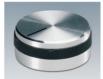
A1432469 BOUTON, à fixation latérale par vis ABS (UL 94 HB) brillant 31,9x14mm 6mm