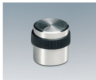
A1416449 BOUTON, à fixation latérale par vis ABS (UL 94 HB) brillant 15,9x15mm 4mm