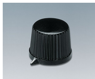
A1313540 BOUTON, à fixation latérale par vis PF (UL 94 V-0) noir RAL 9005 20x15,4mm 4mm