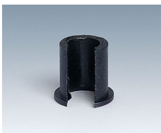
A1300040 Réducteur ABS (UL 94 HB) noir RAL 9005 7,4x7mm 4mm

Sous réserve de modifications techniques. © OKW Gehäusesysteme, Buchen/Allemagne.