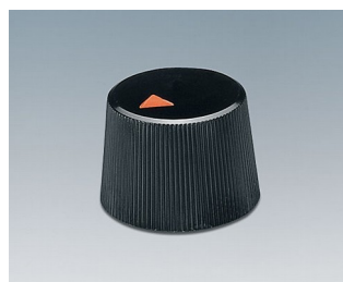
A1316240 BOUTON, à fixation latérale par vis ABS (UL 94 HB) noir RAL 9005 16,4x12,3mm 4mm