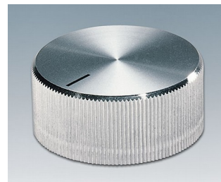
A1432261 BOUTON, à fixation latérale par vis ABS (UL 94 HB) brillant 32,8x14,4mm 6mm