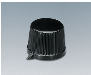
A1685540 BOUTON, à fixation latérale par vis PC noir RAL 9005 11,4x10,5mm 4mm