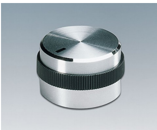
A1422469 BOUTON, à fixation latérale par vis ABS (UL 94 HB) brillant 22,2x17,9mm 6mm