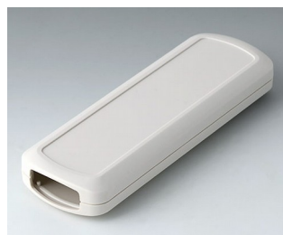
B2834107 CONNECT M ASA+PC (UL 94 V-0) gris blanc RAL 9002 156x54x22mm