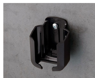
B2921509 Support S ASA+PC (UL 94 V-0) noir RAL 9005