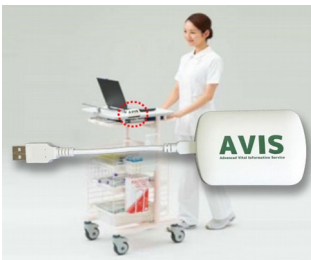
Récepteur pour la transmission de données