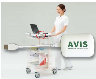
Récepteur pour la transmission de données