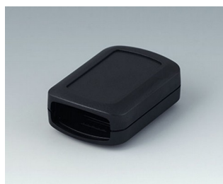
B2822109 CONNECT S ASA+PC (UL 94 V-0) noir RAL 9005 60x42x22mm