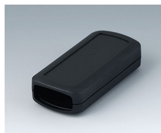
B2823109 CONNECT S ASA+PC (UL 94 V-0) noir RAL 9005 90x42x22mm