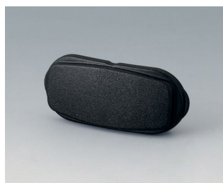
B2811209 Élément d'extrémité ASA+PC (UL 94 V-0) noir RAL 9005