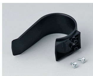
A9167029 Étrier de retenue PA 6 (UL 94 HB) noir RAL 9005