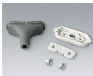
B2911328 Kit passe-câbles, 5,0 - 5,9 TPE volcan