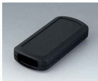
B2833109 CONNECT M ASA+PC (UL 94 V-0) noir RAL 9005 116x54x22mm