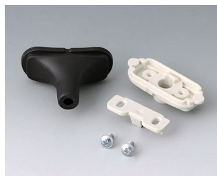
B2911319 Kit passe-câbles, 4,2 - 5,0 TPE noir RAL 9005