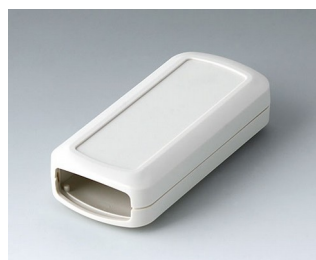
B2823107 CONNECT S ASA+PC (UL 94 V-0) gris blanc RAL 9002 90x42x22mm