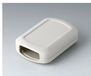
B2832107 CONNECT M ASA+PC (UL 94 V-0) gris blanc RAL 9002 76x54x22mm