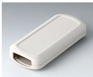
B2833107 CONNECT M ASA+PC (UL 94 V-0) gris blanc RAL 9002 116x54x22mm