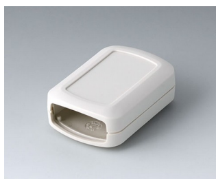
B2822107 CONNECT S ASA+PC (UL 94 V-0) gris blanc RAL 9002 60x42x22mm