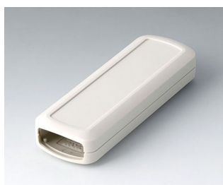
B2824107 CONNECT S ASA+PC (UL 94 V-0) gris blanc RAL 9002 120x42x22mm