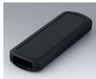
B2834109 CONNECT M ASA+PC (UL 94 V-0) noir RAL 9005 156x54x22mm