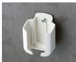
B2921507 Support S ASA+PC (UL 94 V-0) gris blanc RAL 9002