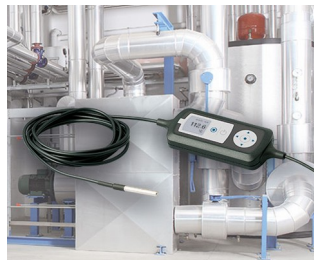
Surveillance de processus avec capteur de température