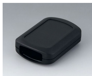
B2832109 CONNECT M ASA+PC (UL 94 V-0) noir RAL 9005 76x54x22mm