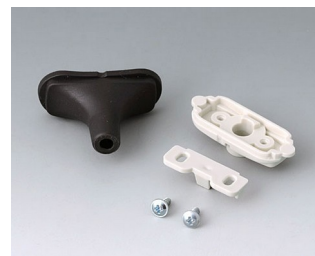
B2911329 Kit passe-câbles, 5,0 - 5,9 TPE noir RAL 9005