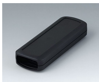
B2824109 CONNECT S ASA+PC (UL 94 V-0) noir RAL 9005 120x42x22mm