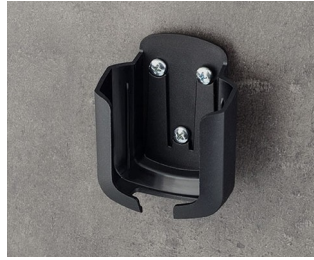
B2931509 Support M ASA+PC (UL 94 V-0) noir RAL 9005