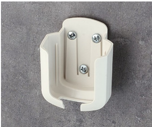
B2931507 Support M ASA+PC (UL 94 V-0) gris blanc RAL 9002