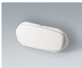
B2811207 Élément d'extrémité ASA+PC (UL 94 V-0) gris blanc RAL 9002