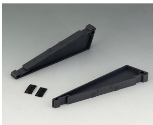
B3507030 Kit support pupitre ASA+PC (UL 94 V-0) lava