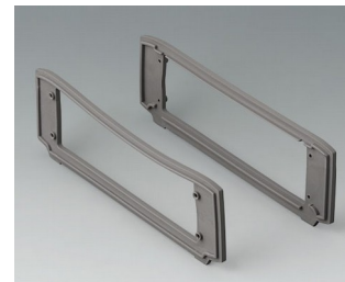
B3507017 Jeu de joints, volcan TPV 50A volcan