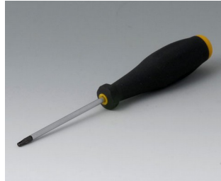
A0399T10 Tournevis Torx T10