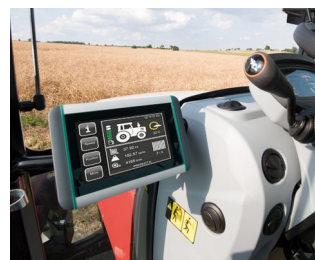
Terminal ISOBUS pour tracteurs et machines automotrices