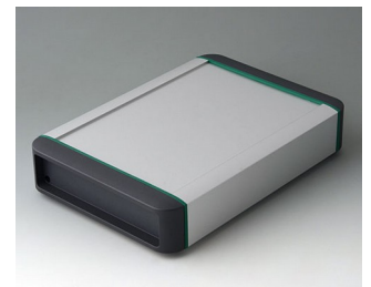
B3407021 SMART-TERMINAL 200 Aluminium AlMgSi 0,5 anodisé mat 242x170x50mm IP 54