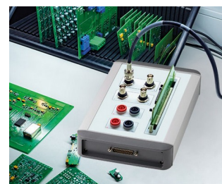
Contrôle de qualité des composants électroniques