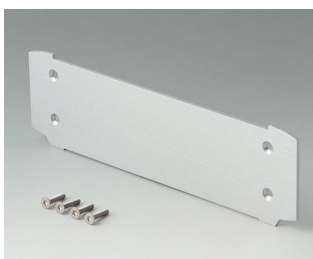
B3507025 Plaque de fermeture Aluminium anodisé mat