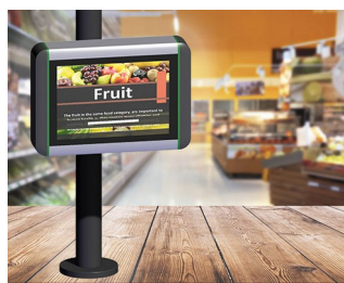
Borne d'information dans les points de vente