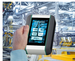
Système de surveillance en temps réel de la machine