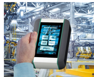
Système de surveillance en temps réel de la machine