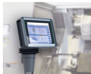
Panneau multi-touche pour le contrôle de la machine