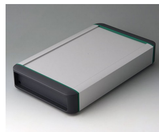
B3407031 SMART-TERMINAL 240 Aluminium AlMgSi 0,5 anodisé mat 282x170x50mm IP 54