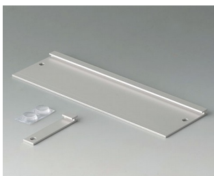
B3507020 Jeu de support mural Aluminium