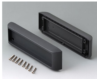
B3507011 Jeu de couvercles ASA+PC (UL 94 V-0) lava