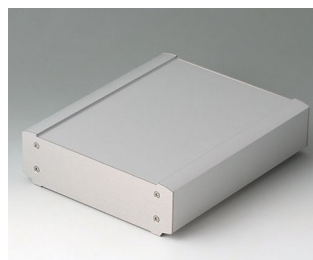
B3407023 SMART-TERMINAL 200 Aluminium AlMgSi 0,5 anodisé mat 204x170x50mm