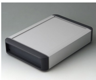
B3407022 SMART-TERMINAL 200 Aluminium AlMgSi 0,5 anodisé mat 242x170x50mm IP 54