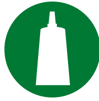
Assemblage / montage