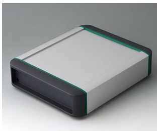
B3407011 SMART-TERMINAL 160 Aluminium AlMgSi 0,5 anodisé mat 202x170x50mm IP 54