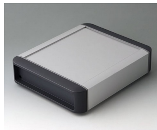
B3407012 SMART-TERMINAL 160 Aluminium AlMgSi 0,5 anodisé mat 202x170x50mm IP 54