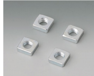
B3500001 Jeu d'écrous carrés M3 Acier