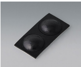
A9209229 Pieds anti-glissant 8,5 x 2,2 mm noir

Sous réserve de modifications techniques. © OKW Gehäusesysteme, Buchen/Allemagne.