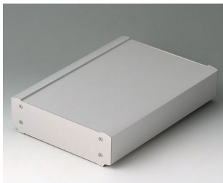
B3407033 SMART-TERMINAL 240 Aluminium AlMgSi 0,5 anodisé mat 244x170x50mm