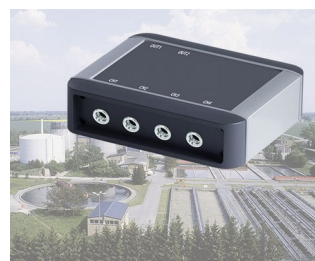
Contrôle de processus des usines