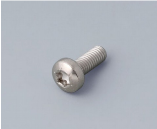
A0330080 Vis M3 x 8 mm (T10) Acier inoxydable