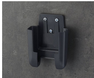
A9105628 Support S ASA+PC (UL 94 V-0) lava