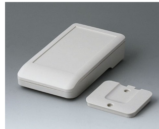
A9005217 DATEC-COMPACT S ASA+PC (UL 94 V-0) gris blanc RAL 9002 136x74x32mm IP 41