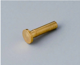
A9193030 Broche de contact doré