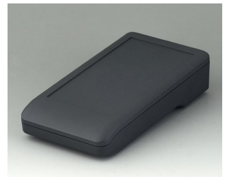
A9006118 DATEC-COMPACT M ASA+PC (UL 94 V-0) lava 172x92x39mm IP 41