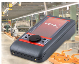
Appareil de diagnostic pour les bus CAN et CAN-FD