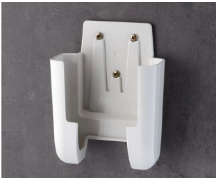
A9107627 Support L ASA+PC (UL 94 V-0) gris blanc RAL 9002