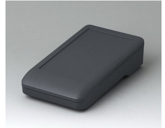
A9005118 DATEC-COMPACT S ASA+PC (UL 94 V-0) lava 136x74x32mm IP 41