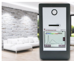
Instrument de mesure de la lumière spectrale