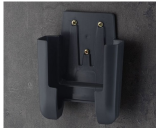
A9107628 Support L ASA+PC (UL 94 V-0) lava