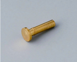
A9193030 Broche de contact doré