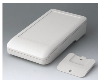
A9007217 DATEC-COMPACT L ASA+PC (UL 94 V-0) gris blanc RAL 9002 206x110x47mm IP 41