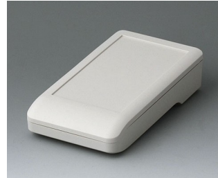
A9005117 DATEC-COMPACT S ASA+PC (UL 94 V-0) gris blanc RAL 9002 136x74x32mm IP 41