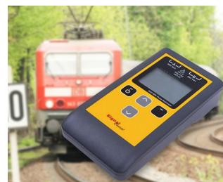
Multimètre testeur de phases