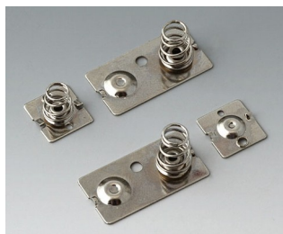
A9190023 Ressorts de contact, 3 x AA Acier nickelé