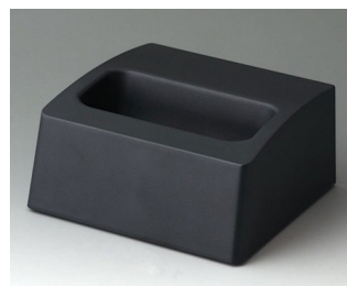
A9106508 Socle M ASA+PC (UL 94 V-0) lava