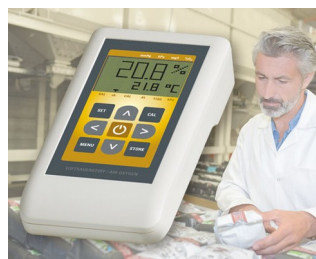
Instrument de mesure de l'oxygène de l'air