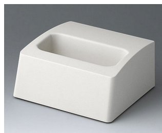
A9106507 Socle M ASA+PC (UL 94 V-0) gris blanc RAL 9002