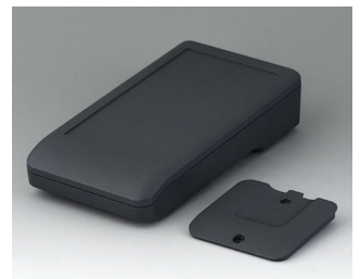
A9006218 DATEC-COMPACT M ASA+PC (UL 94 V-0) lava 172x92x39mm IP 41