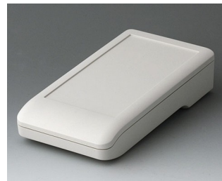
A9006117 DATEC-COMPACT M ASA+PC (UL 94 V-0) gris blanc RAL 9002 172x92x39mm IP 41