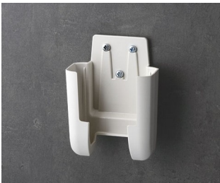
A9105627 Support S ASA+PC (UL 94 V-0) gris blanc RAL 9002