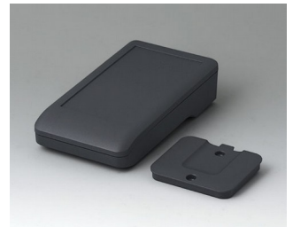
A9005218 DATEC-COMPACT S ASA+PC (UL 94 V-0) lava 136x74x32mm IP 41