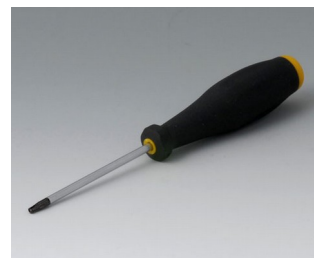
A0399T08 Tournevis Torx T8