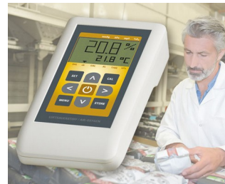
Instrument de mesure de l'oxygène de l'air