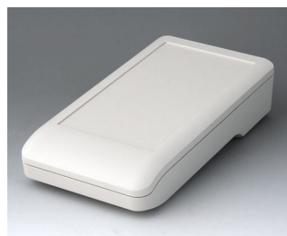
A9007117 DATEC-COMPACT L ASA+PC (UL 94 V-0) gris blanc RAL 9002 206x110x47mm IP 41