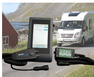
SYSTÈME DE CONTRÔLES DE PRESENCE D'HUMIDITE