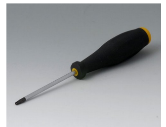
A0399T10 Tournevis Torx T10