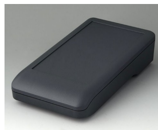
A9007118 DATEC-COMPACT L ASA+PC (UL 94 V-0) lava 206x110x47mm IP 41