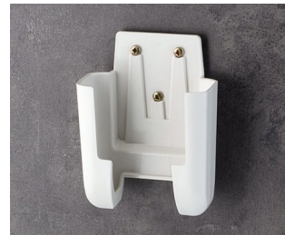
A9106627 Support M ASA+PC (UL 94 V-0) gris blanc RAL 9002