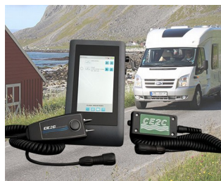
SYSTÈME DE CONTRÔLES DE PRESENCE D'HUMIDITE