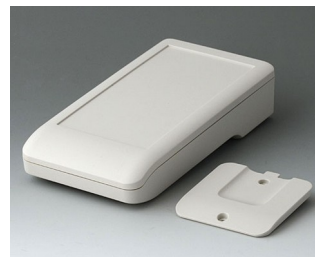
A9006217 DATEC-COMPACT M ASA+PC (UL 94 V-0) gris blanc RAL 9002 172x92x39mm IP 41