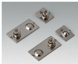
A9190024 Ressorts de contact, 3 x AAA Acier nickelé