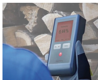
Testeur d'humidité du bois