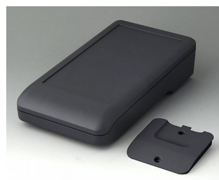
A9007218 DATEC-COMPACT L ASA+PC (UL 94 V-0) lava 206x110x47mm IP 41