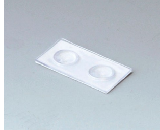
A9207150 Pieds anti-glissant 6,5 x 2 mm transparent

Sous réserve de modifications techniques. © OKW Gehäusesysteme, Buchen/Allemagne.