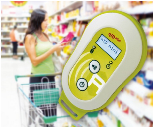
Appareil de lecture mobile UHF-RFID