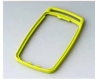
B9004704 Bague intermédiaire EM TPE vert