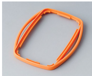
B9004753 Bague intermédiaire EM SEBS (TPE) orange