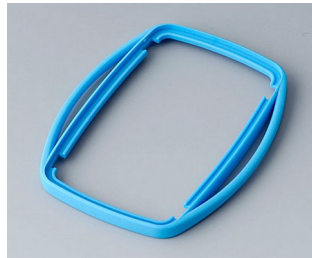
B9006755 Bague intermédiaire EL TPE bleu