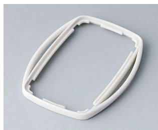
B9004757 Bague intermédiaire EM SEBS (TPE) gris blanc RAL 9002