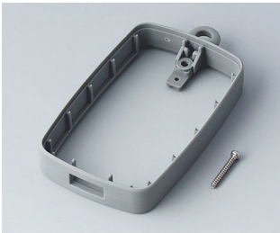
B9004798 Bague intermédiaire EM, type A USB SEBS (TPE) volcan