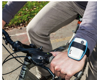
Surveillance mobile de la qualité de l'air