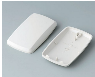
B9004857 Partie inférieure et supérieure EM ABS (UL 94 HB) gris blanc RAL 9002 68x42x18mm