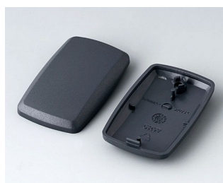
B9002858 Partie inférieure et supérieure ES ABS (UL 94 HB) lava 52x32x15mm