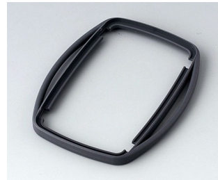
B9006752 Bague intermédiaire EL TPE lava