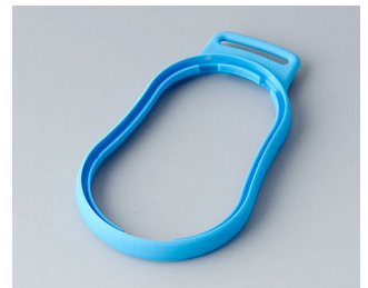
B9004305 Bague intermédiaire DM TPE bleu