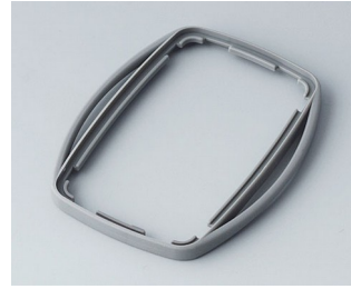
B9004758 Bague intermédiaire EM TPE volcan