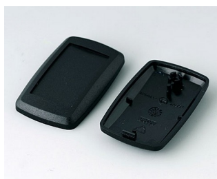
B9002806 Partie inférieure et supérieure ES PMMA (IR) (UL 94 HB) noir RAL 9005 52x32x15mm