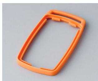
B9002703 Bague intermédiaire ES TPE orange