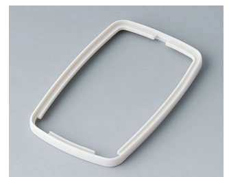
B9006787 Bague intermédiaire EL SEBS (TPE) gris blanc RAL 9002