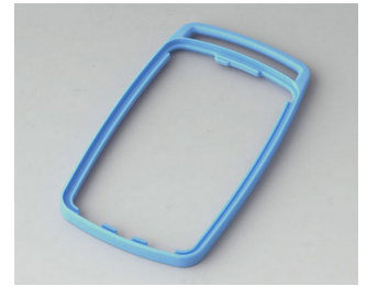
B9004705 Bague intermédiaire EM TPE bleu