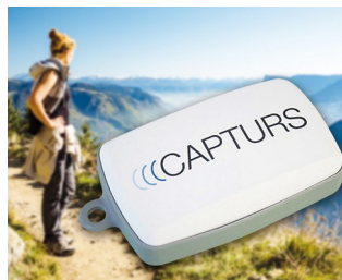
Tracker GPS en temps réel