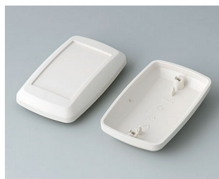
B9006827 Partie inférieure et supérieure EL ABS (UL 94 HB) gris blanc RAL 9002 78x48x26mm