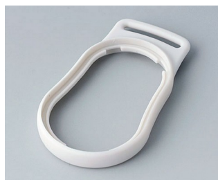
B9002307 Bague intermédiaire DS SEBS (TPE) gris blanc RAL 9002