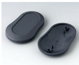
B9006908 Partie inférieure et supérieure DL ABS (UL 94 HB) lava 84x53x19mm