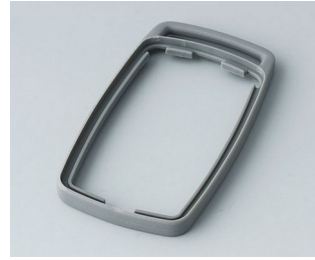
B9002708 Bague intermédiaire ES TPE volcan