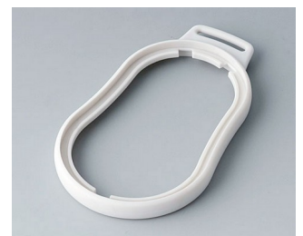
B9006307 Bague intermédiaire DL SEBS (TPE) gris blanc RAL 9002