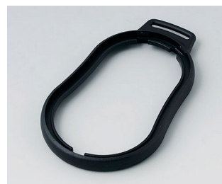
B9006306 Bague intermédiaire DL PMMA (IR) (UL 94 HB) noir RAL 9005