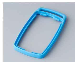
B9002705 Bague intermédiaire ES TPE bleu