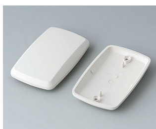
B9006857 Partie inférieure et supérieure EL ABS (UL 94 HB) gris blanc RAL 9002 78x48x20mm