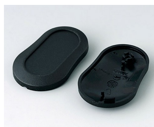
B9002906 Partie inférieure et supérieure DS PMMA (IR) (UL 94 HB) noir RAL 9005 51x32x13mm