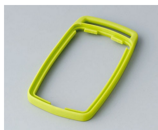
B9002704 Bague intermédiaire ES TPE vert