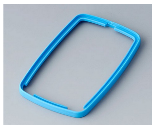
B9006785 Bague intermédiaire EL TPE bleu