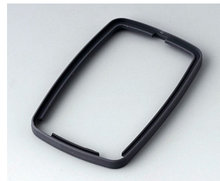
B9006782 Bague intermédiaire EL SEBS (TPE) lava