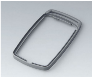
B9006708 Bague intermédiaire EL TPE volcan