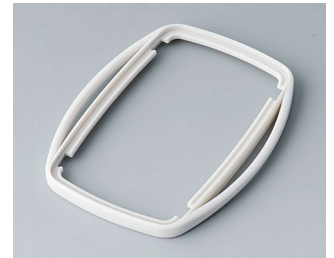
B9006757 Bague intermédiaire EL SEBS (TPE) gris blanc RAL 9002