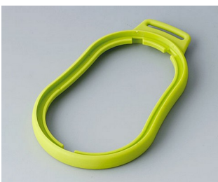
B9006304 Bague intermédiaire DL TPE vert