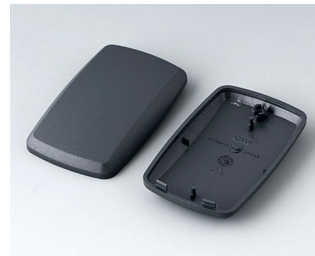
B9004858 Partie inférieure et supérieure EM ABS (UL 94 HB) lava 68x42x18mm