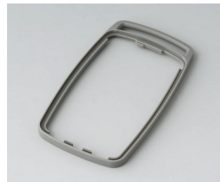
B9004708 Bague intermédiaire EM TPE volcan