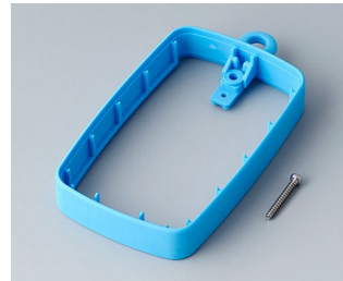
B9004785 Bague intermédiaire EM, surélevé TPE bleu