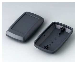
B9006828 Partie inférieure et supérieure EL ABS (UL 94 HB) lava 78x48x26mm