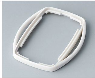
B9002757 Bague intermédiaire ES TPE gris blanc RAL 9002