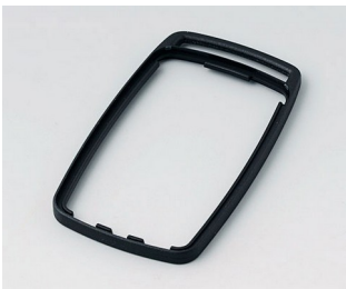
B9004706 Bague intermédiaire EM PMMA (IR) (UL 94 HB) noir RAL 9005