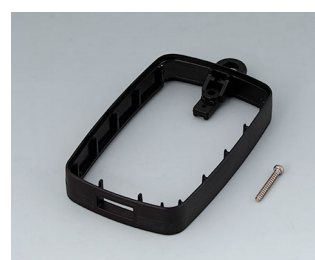
B9004796 Bague intermédiaire EM, type A USB PMMA (IR) (UL 94 HB) noir RAL 9005