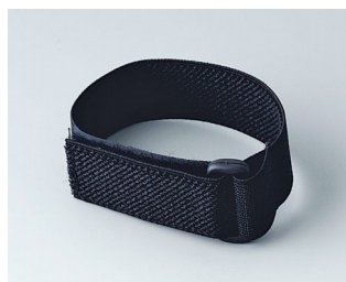
B9100033 Bracelet noir 280mm