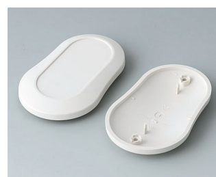
B9006907 Partie inférieure et supérieure DL ABS (UL 94 HB) gris blanc RAL 9002 84x53x19mm