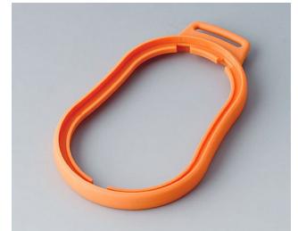
B9006303 Bague intermédiaire DL TPE orange