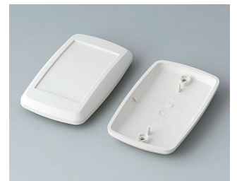
B9006807 Partie inférieure et supérieure EL ABS (UL 94 HB) gris blanc RAL 9002 78x48x20mm