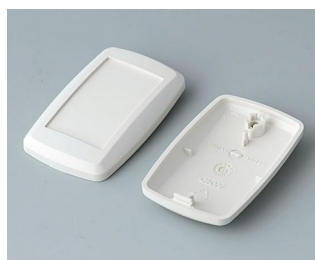
B9002807 Partie inférieure et supérieure ES ABS (UL 94 HB) gris blanc RAL 9002 52x32x15mm