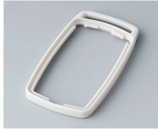
B9002707 Bague intermédiaire ES TPE gris blanc RAL 9002