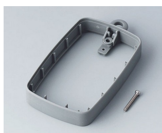
B9004788 Bague intermédiaire EM, surélevé TPE volcan