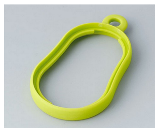
B9002354 Bague intermédiaire DS TPE vert