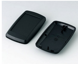
B9004806 Partie inférieure et supérieure EM PMMA (IR) (UL 94 HB) noir RAL 9005 68x42x18mm