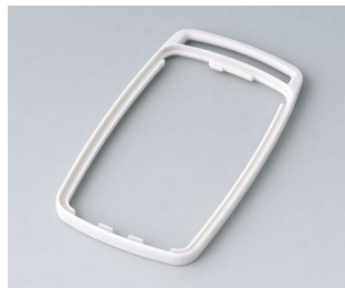
B9004707 Bague intermédiaire EM TPE gris blanc RAL 9002