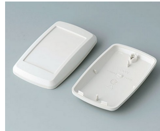
B9004807 Partie inférieure et supérieure EM ABS (UL 94 HB) gris blanc RAL 9002 68x42x18mm