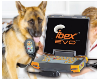
Appareil portable à ultrasons pour la médecine vétérinaire