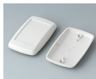
B9006807 Partie inférieure et supérieure EL ABS (UL 94 HB) gris blanc RAL 9002 78x48x20mm