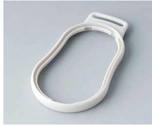
B9004307 Bague intermédiaire DM SEBS (TPE) gris blanc RAL 9002