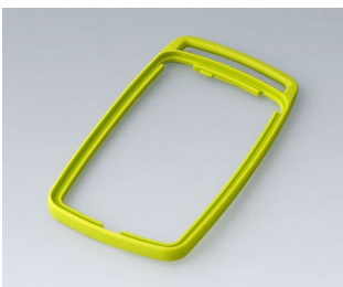
B9006704 Bague intermédiaire EL SEBS (TPE) vert