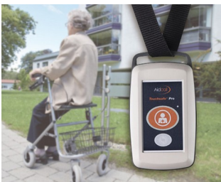
Émetteur radio pour système d'appel d'urgence patient