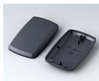
B9004858 Partie inférieure et supérieure EM ABS (UL 94 HB) lava 68x42x18mm