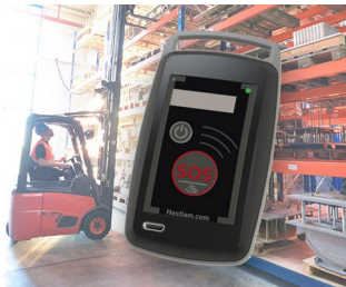
Solution de sécurité portée par le travailleur