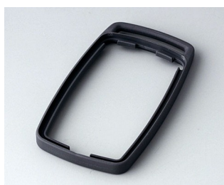
B9002702 Bague intermédiaire ES TPE lava