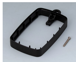
B9004786 Bague intermédiaire EM, surélevé PMMA (IR) (UL 94 HB) noir RAL 9005