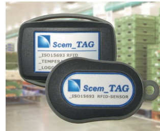
Capteur transpondeur et enregistreur de données RFID