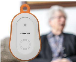
Traceur GPS LoRa avec bouton d'alarme