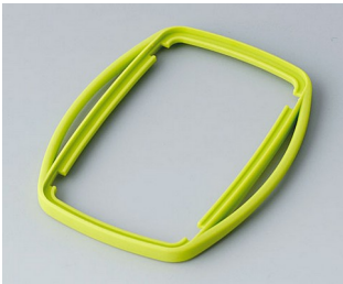
B9006754 Bague intermédiaire EL SEBS (TPE) vert