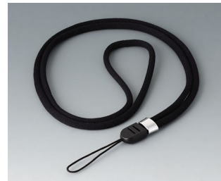
B9100063 Collier, textile noir 860mm