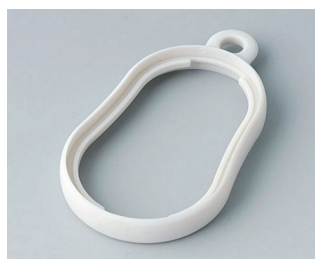
B9002357 Bague intermédiaire DS SEBS (TPE) gris blanc RAL 9002