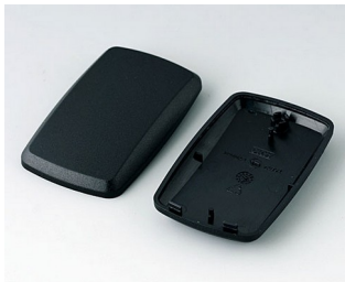
B9004856 Partie inférieure et supérieure EM PMMA (IR) (UL 94 HB) noir RAL 9005 68x42x18mm