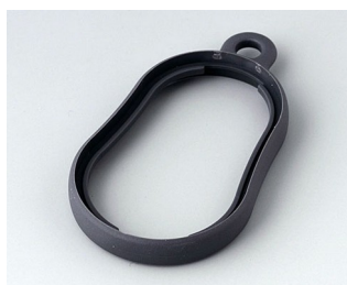
B9002352 Bague intermédiaire DS TPE lava