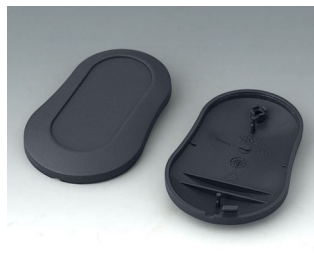
B9004908 Partie inférieure et supérieure DM ABS (UL 94 HB) lava 70x44x16mm