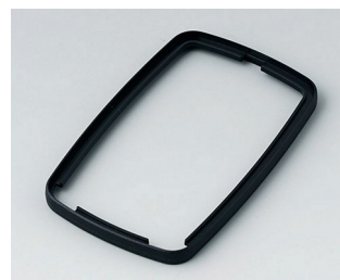
B9006786 Bague intermédiaire EL PMMA (IR) (UL 94 HB) noir RAL 9005