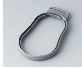
B9004308 Bague intermédiaire DM TPE volcan