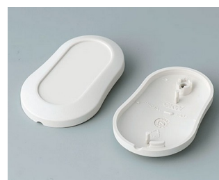
B9002907 Partie inférieure et supérieure DS ABS (UL 94 HB) gris blanc RAL 9002 51x32x13mm