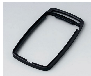
B9006706 Bague intermédiaire EL PMMA (IR) (UL 94 HB) noir RAL 9005