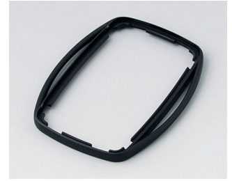
B9004759 Bague intermédiaire EM ABS (UL 94 HB) noir RAL 9005