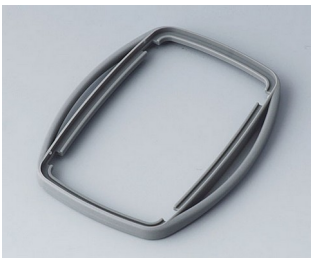
B9006758 Bague intermédiaire EL TPE volcan