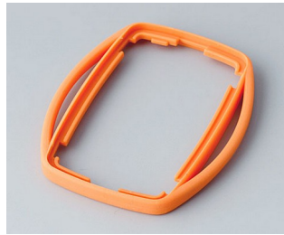
B9002753 Bague intermédiaire ES TPE orange