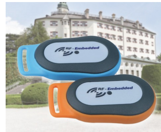
Système d'information RFID mobile