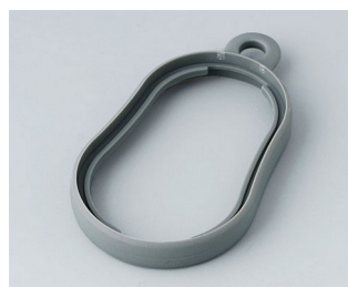
B9002358 Bague intermédiaire DS TPE volcan