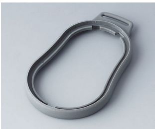
B9006308 Bague intermédiaire DL TPE volcan