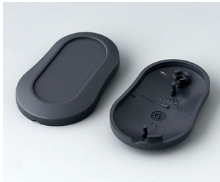
B9002908 Partie inférieure et supérieure DS ABS (UL 94 HB) lava 51x32x13mm