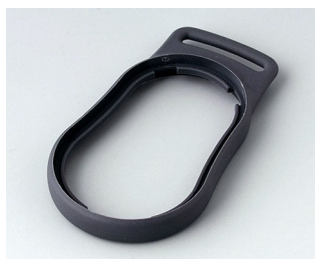
B9002302 Bague intermédiaire DS TPE lava