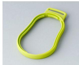
B9004304 Bague intermédiaire DM TPE vert