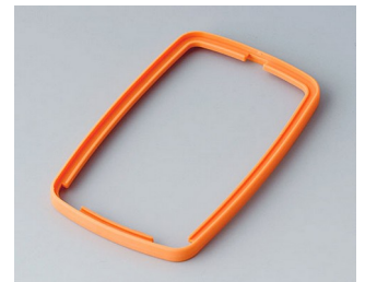
B9006783 Bague intermédiaire EL TPE orange