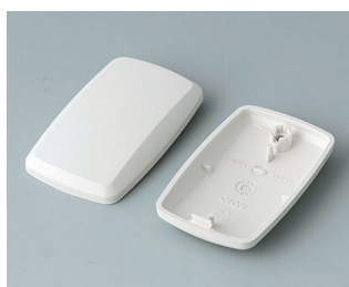
B9002857 Partie inférieure et supérieure ES ABS (UL 94 HB) gris blanc RAL 9002 52x32x15mm