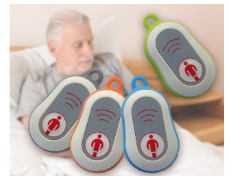
Émetteur d'appel radio en médaillon