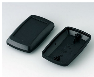
B9006826 Partie inférieure et supérieure EL PMMA (IR) (UL 94 HB) noir RAL 9005 78x48x26mm