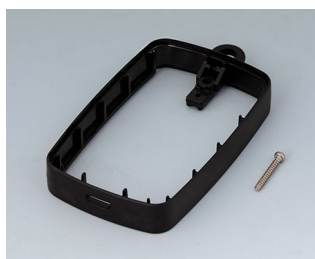
B9004776 Bague intermédiaire EM, Micro USB 5 P, B Type SMT PMMA (IR) (UL 94 HB) noir RAL 9005