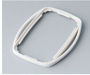
B9004757 Bague intermédiaire EM SEBS (TPE) gris blanc RAL 9002