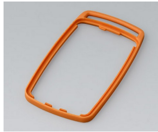
B9004703 Bague intermédiaire EM TPE orange