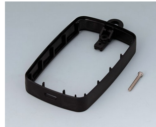
B9004779 Bague intermédiaire EM, Micro USB 5 P, B Type SMT ABS (UL 94 HB) noir RAL 9005