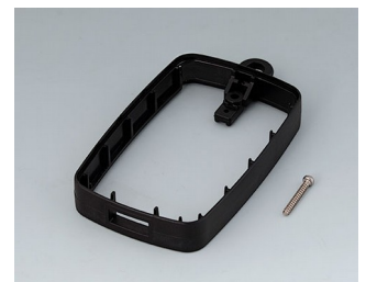
B9004796 Bague intermédiaire EM, type A USB PMMA (IR) (UL 94 HB) noir RAL 9005