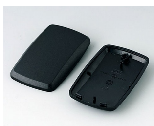
B9004856 Partie inférieure et supérieure EM PMMA (IR) (UL 94 HB) noir RAL 9005 68x42x18mm