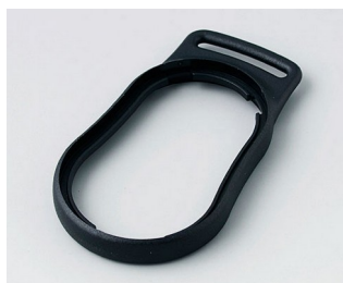
B9002306 Bague intermédiaire DS PMMA (IR) (UL 94 HB) noir RAL 9005