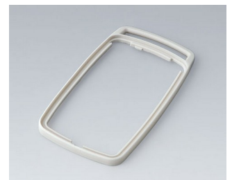
B9006707 Bague intermédiaire EL SEBS (TPE) gris blanc RAL 9002