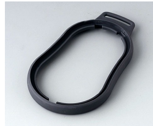
B9006302 Bague intermédiaire DL TPE lava