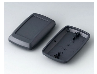
B9006818 Partie inférieure et supérieure EL ABS (UL 94 HB) lava 78x48x24mm