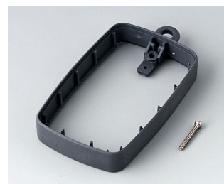
B9004782 Bague intermédiaire EM, surélevé SEBS (TPE) lava