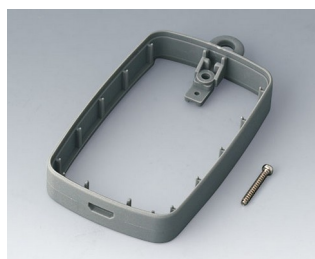
B9004778 Bague intermédiaire EM, Micro USB 5 P, B Type SMT SEBS (TPE) volcan