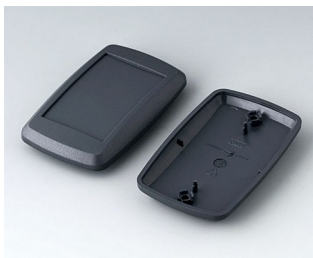
B9006808 Partie inférieure et supérieure EL ABS (UL 94 HB) lava 78x48x20mm