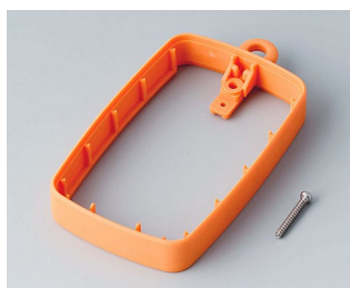
B9004783 Bague intermédiaire EM, surélevé TPE orange