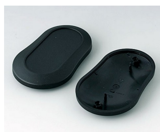
B9006906 Partie inférieure et supérieure DL PMMA (IR) (UL 94 HB) noir RAL 9005 84x53x19mm