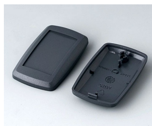
B9002808 Partie inférieure et supérieure ES ABS (UL 94 HB) lava 52x32x15mm