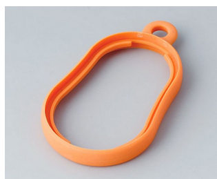
B9002353 Bague intermédiaire DS TPE orange