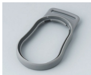
B9002308 Bague intermédiaire DS TPE volcan