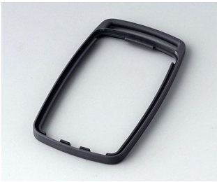
B9004702 Bague intermédiaire EM TPE lava