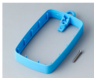
B9004785 Bague intermédiaire EM, surélevé TPE bleu