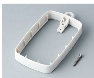
B9004787 Bague intermédiaire EM, surélevé SEBS (TPE) gris blanc RAL 9002