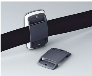
B9106108 Oeillet de fixation passe- dragonne EL ABS (UL 94 HB) lava