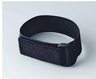
B9100033 Bracelet noir 280mm