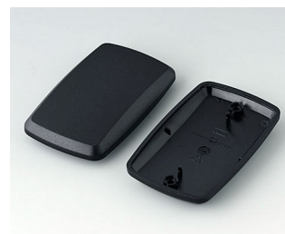
B9006856 Partie inférieure et supérieure EL PMMA (IR) (UL 94 HB) noir RAL 9005 78x48x20mm