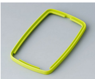
B9006784 Bague intermédiaire EL SEBS (TPE) vert