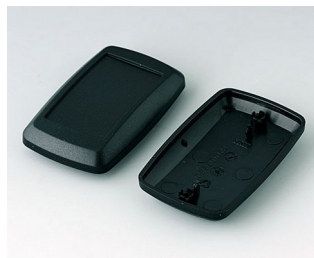
B9006816 Partie inférieure et supérieure EL PMMA (IR) (UL 94 HB) noir RAL 9005 78x48x24mm