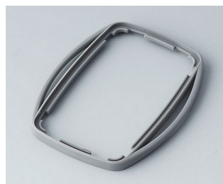
B9004758 Bague intermédiaire EM TPE volcan