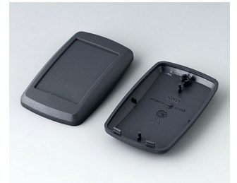
B9004808 Partie inférieure et supérieure EM ABS (UL 94 HB) lava 68x42x18mm