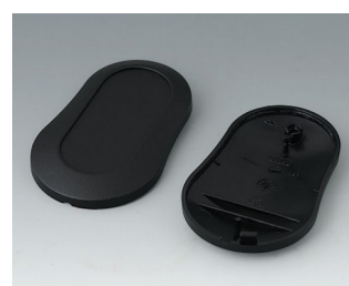
B9004906 Partie inférieure et supérieure DM PMMA (IR) (UL 94 HB) noir RAL 9005 70x44x16mm