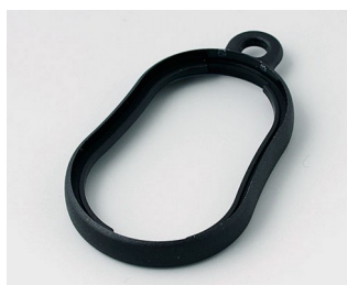
B9002356 Bague intermédiaire DS PMMA (IR) (UL 94 HB) noir RAL 9005