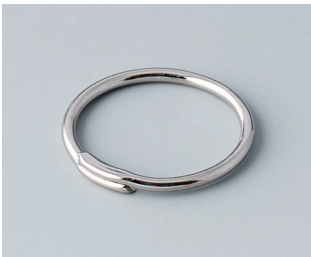
A9164001 Anse Acier nickelé 20,5mm