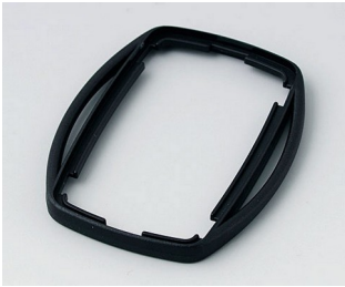
B9002756 Bague intermédiaire ES PMMA (IR) (UL 94 HB) noir RAL 9005