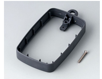
B9004782 Bague intermédiaire EM, surélevé SEBS (TPE) lava