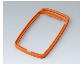
B9006703 Bague intermédiaire EL TPE orange