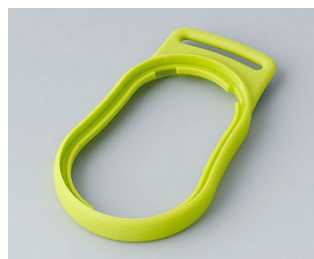
B9002304 Bague intermédiaire DS SEBS (TPE) vert