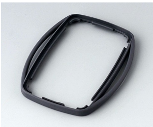
B9004752 Bague intermédiaire EM TPE lava