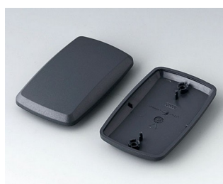
B9006858 Partie inférieure et supérieure EL ABS (UL 94 HB) lava 78x48x20mm