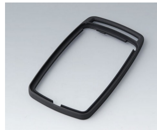
B9006702 Bague intermédiaire EL TPE lava