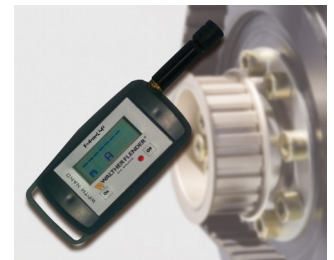
Tensiomètre pour mesurer la prétention de courroies