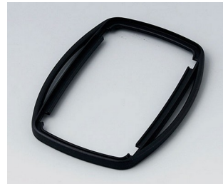
B9006756 Bague intermédiaire EL PMMA (IR) (UL 94 HB) noir RAL 9005