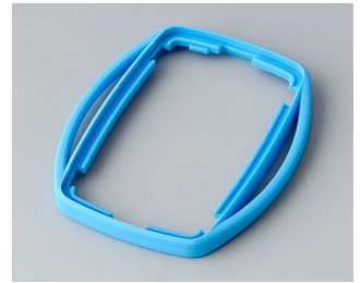
B9002755 Bague intermédiaire ES TPE bleu