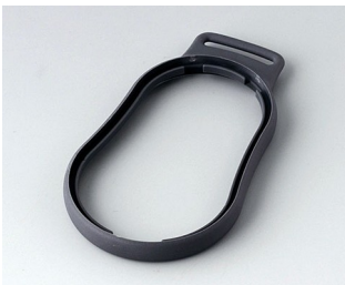
B9004302 Bague intermédiaire DM TPE lava