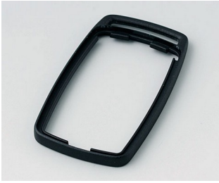
B9002706 Bague intermédiaire ES PMMA (IR) (UL 94 HB) noir RAL 9005