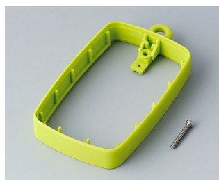
B9004784 Bague intermédiaire EM, surélevé SEBS (TPE) vert