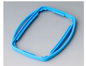
B9004755 Bague intermédiaire EM TPE bleu