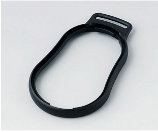
B9004306 Bague intermédiaire DM PMMA (IR) (UL 94 HB) noir RAL 9005