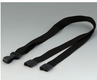
B9100073 Collier, textile noir 914x16mm