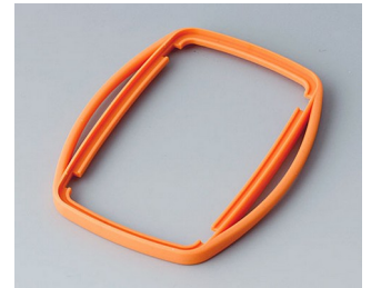
B9006753 Bague intermédiaire EL TPE orange