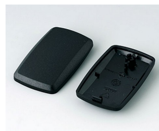
B9002856 Partie inférieure et supérieure ES PMMA (IR) (UL 94 HB) noir RAL 9005 52x32x15mm