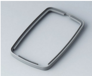
B9006788 Bague intermédiaire EL TPE volcan