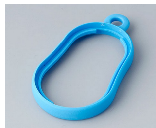
B9002355 Bague intermédiaire DS TPE bleu