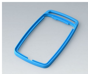
B9006705 Bague intermédiaire EL TPE bleu