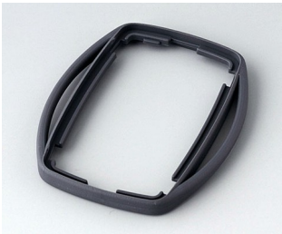
B9002752 Bague intermédiaire ES TPE lava