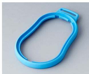
B9006305 Bague intermédiaire DL TPE bleu