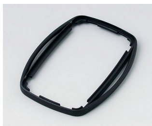
B9004756 Bague intermédiaire EM PMMA (IR) (UL 94 HB) noir RAL 9005