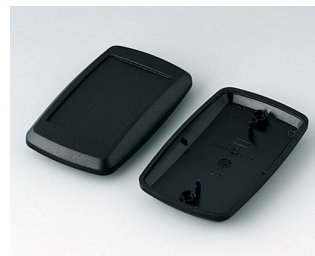
B9006806 Partie inférieure et supérieure EL PMMA (IR) (UL 94 HB) noir RAL 9005 78x48x20mm