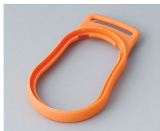
B9002303 Bague intermédiaire DS SEBS (TPE) orange