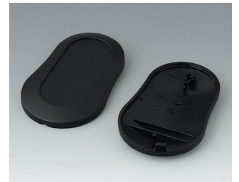
B9004906 Partie inférieure et supérieure DM PMMA (IR) (UL 94 HB) noir RAL 9005 70x44x16mm