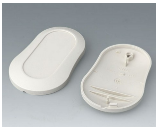
B9004907 Partie inférieure et supérieure DM ABS (UL 94 HB) gris blanc RAL 9002 70x44x16mm