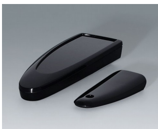
B2802016 STYLE-CASE S PMMA (IR) (UL 94 HB) noir RAL 9005 123x48x24mm IP 40