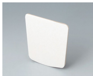
B2904031 Pellicule adhésive L