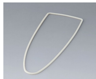
B2904011 Joint L TPV 50A