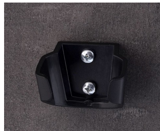
B2902039 Support S ASA (UL 94 HB) noir RAL 9005