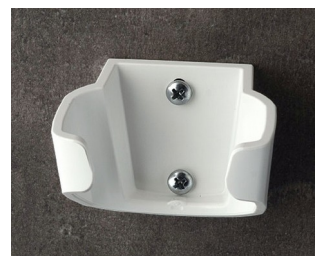
B2904037 Support L ASA (UL 94 HB) blanc signalisation RAL 9016