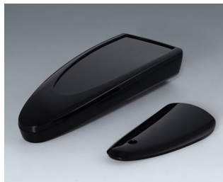
B2804016 STYLE-CASE L PMMA (IR) (UL 94 HB) noir RAL 9005 166x64x31mm IP 65 opt., IP 40