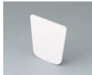
B2903031 Pellicule adhésive M