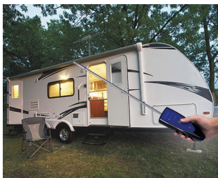
Détecteur de gaz mobile