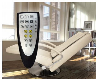
Élément de commande pour fauteuils de massage