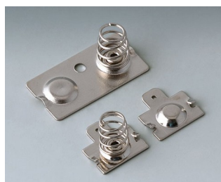
B2904210 Jeu de ressorts de contact Acier nickelé