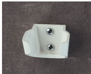
B2902037 Support S ASA (UL 94 HB) blanc signalisation RAL 9016