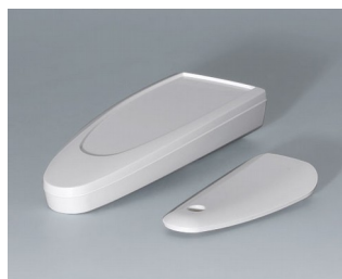
B2802017 STYLE-CASE S ASA (UL 94 HB) blanc signalisation RAL 9016 123x48x24mm IP 40