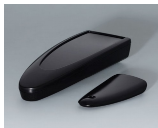
B2803016 STYLE-CASE M PMMA (IR) (UL 94 HB) noir RAL 9005 147x56x27mm IP 65 opt., IP 40