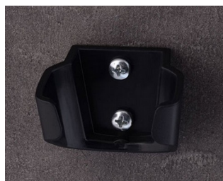
B2903039 Support M ASA (UL 94 HB) noir RAL 9005