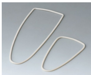
B2904111 Jeu de joints L TPV 50A