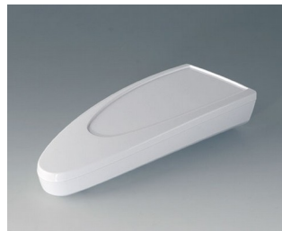
B2804027 STYLE-CASE L ASA (UL 94 HB) blanc signalisation RAL 9016 166x64x31mm IP 65 opt., IP 40