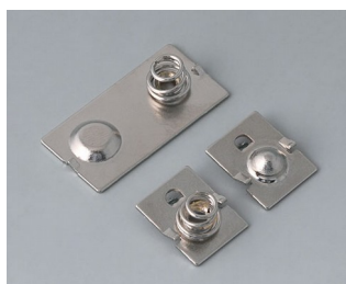
A9190020 Jeu de ressorts de contact Acier nickelé