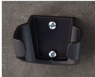
B2904039 Support L ASA (UL 94 HB) noir RAL 9005