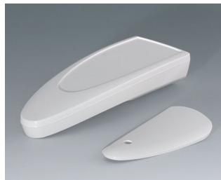
B2804017 STYLE-CASE L ASA (UL 94 HB) blanc signalisation RAL 9016 166x64x31mm IP 65 opt., IP 40