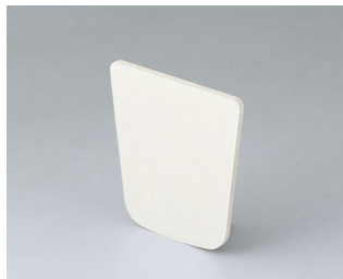
B2902031 Pellicule adhésive S