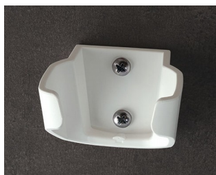
B2903037 Support M ASA (UL 94 HB) blanc signalisation RAL 9016