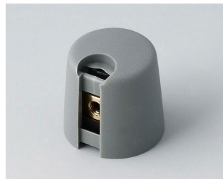
A1016068 TOP-KNOBS 16 PA 6 volcan 16x16mm 6mm