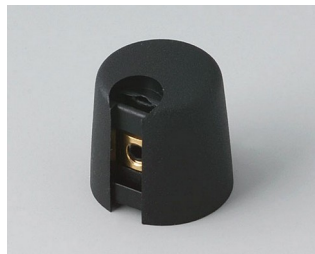
A1016049 TOP-KNOBS 16 PA 6 néro 16x16mm 4mm