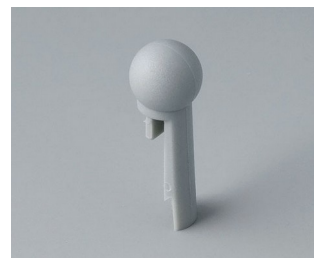
A1102007 À bout sphérique PA 6 (UL 94 HB) minéral