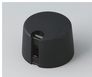
A1024649 TOP-KNOBS 24 PA 6 néro 24x16mm