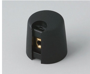
A1016049 TOP-KNOBS 16 PA 6 néro 16x16mm 4mm