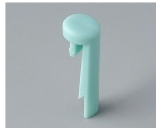
A1101005 Goupille PA 6 (UL 94 HB) lagon