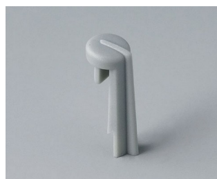
A1105007 Skala PA 6 (UL 94 HB) minéral