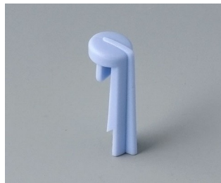
A1105006 Skala PA 6 (UL 94 HB) ciel