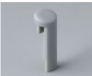
A1101007 Goupille PA 6 (UL 94 HB) minéral