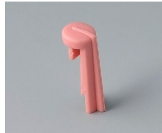
A1105003 Skala PA 6 (UL 94 HB) corail