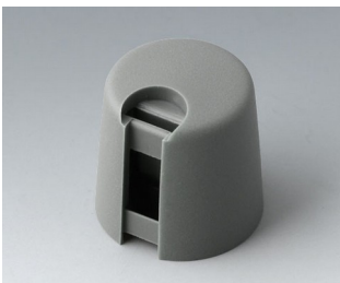
A1016648 TOP-KNOBS 16 PA 6 volcan 16x16mm