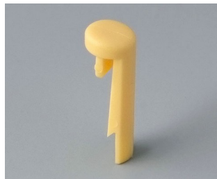
A1101004 Goupille PA 6 (UL 94 HB) plage