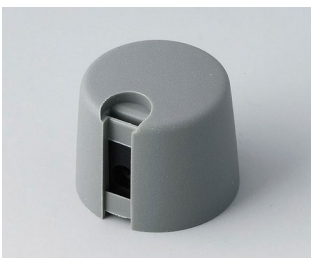
A1020648 TOP-KNOBS 20 PA 6 volcan 20x16mm