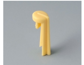
A1105004 Skala PA 6 (UL 94 HB) plage