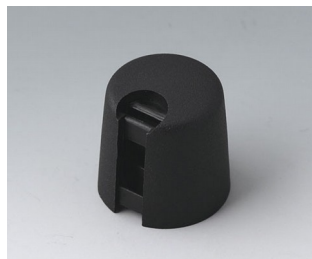
A1016649 TOP-KNOBS 16 PA 6 néro 16x16mm