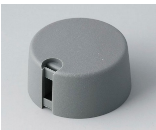
A1031648 TOP-KNOBS 31 PA 6 volcan 31x16mm