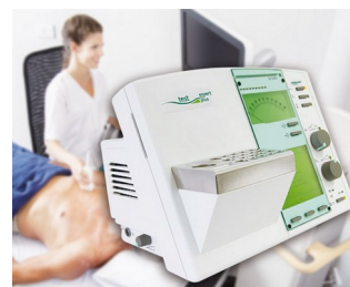
Élément de commande pour appareil de diagnostic