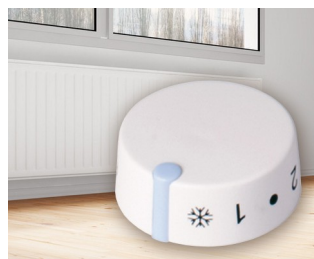
Thermostat encastrable pour chauffage électrique à accumulation