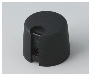
A1020649 TOP-KNOBS 20 PA 6 néro 20x16mm