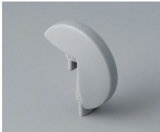
A1103007 Disque PA 6 (UL 94 HB) minéral