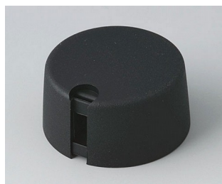
A1031649 TOP-KNOBS 31 PA 6 néro 31x16mm