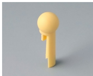
A1102004 À bout sphérique PA 6 (UL 94 HB) plage