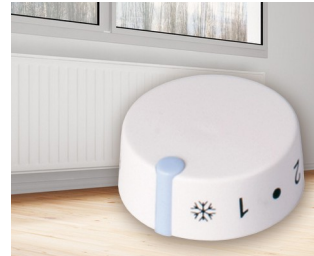
Thermostat encastrable pour chauffage électrique à accumulation