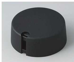
A1040649 TOP-KNOBS 40 PA 6 néro 40x16mm