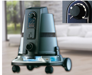
Élément de commande pour aspirateur de sol