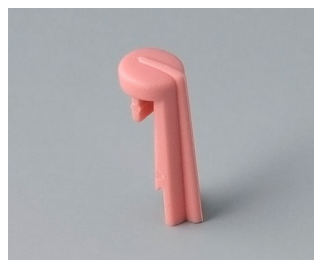
A1105003 Skala PA 6 (UL 94 HB) corail