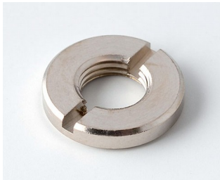
A6207009 Écrou rond M7 x 0,75