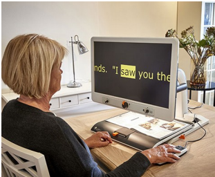
Boutons de commande pour téléagrandisseur