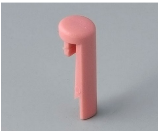
A1101003 Goupille PA 6 (UL 94 HB) corail