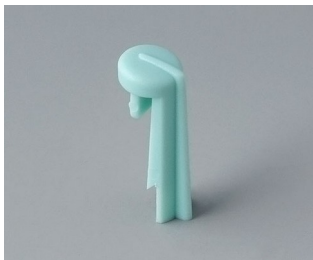
A1105005 Skala PA 6 (UL 94 HB) lagon