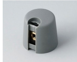
A1016068 TOP-KNOBS 16 PA 6 volcan 16x16mm 6mm