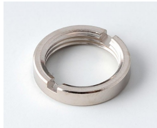
A6210009 Écrou rond M10 x 0,75