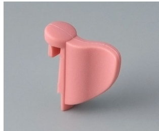
A1104003 En drapeau PA 6 (UL 94 HB) corail