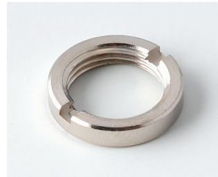
A6295009 Écrou rond 3/8"-32G

Sous réserve de modifications techniques. © OKW Gehäusesysteme, Buchen/Allemagne.