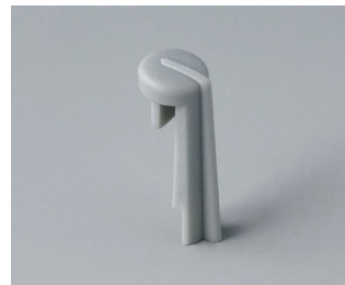
A1105007 Skala PA 6 (UL 94 HB) minéral