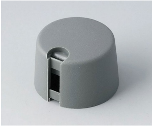
A1024068 TOP-KNOBS 24 PA 6 volcan 24x16mm 6mm