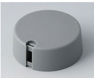
A1040648 TOP-KNOBS 40 PA 6 volcan 40x16mm