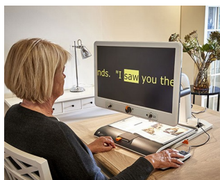
Boutons de commande pour téléagrandisseur