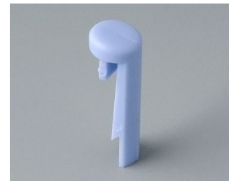
A1101006 Goupille PA 6 (UL 94 HB) ciel