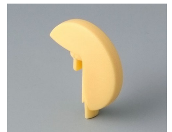
A1103004 Disque PA 6 (UL 94 HB) plage