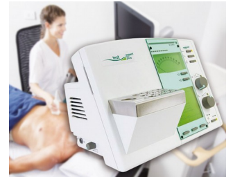
Élément de commande pour appareil de diagnostic