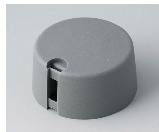
A1031048 TOP-KNOBS 31 PA 6 volcan 31x16mm 4mm