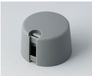
A1024648 TOP-KNOBS 24 PA 6 volcan 24x16mm