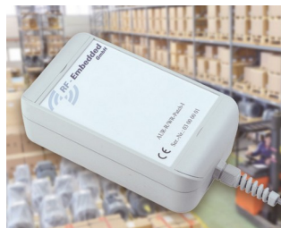
Système UHF RFID actif