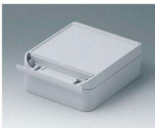
C6013161 SMART-BOX 130 LARGE ASA+PC (UL 94 V-0) gris clair RAL 7035 160x130x60mm IP 66