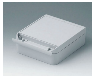
C6015181 SMART-BOX 150 LARGE ASA+PC (UL 94 V-0) gris clair RAL 7035 180x150x60mm IP 66