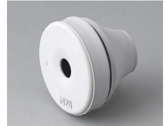
C2320137 Passe-câble EPDM gris clair RAL 7035 IP 67