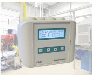
Régulateur de température universel/de température différentielle