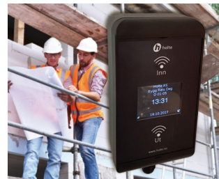
Lecteur de cartes RFID pour les collaborateurs sur chantiers