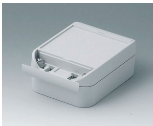
C6009121 SMART-BOX 90 LARGE ASA+PC (UL 94 V-0) gris clair RAL 7035 120x90x50mm IP 66