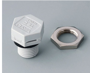
C2310917 Élément à compensation de pression M10x1 PA 6 (UL 94 HB) gris clair RAL 7035 IP 56