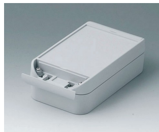
C6009161 SMART-BOX 90 LARGE ASA+PC (UL 94 V-0) gris clair RAL 7035 160x90x50mm IP 66