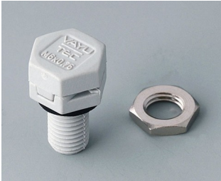
C2306917 Élément à compensation de pression M6x0,75 PA 6 (UL 94 HB) gris clair RAL 7035 IP 56