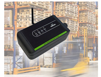
Pedestrian Alert System