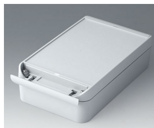
C6013221 SMART-BOX 130 LARGE ASA+PC (UL 94 V-0) gris clair RAL 7035 220x130x60mm IP 66