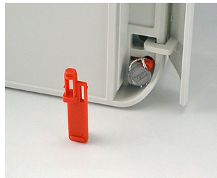
C6100006 Fiche de plombage PA 6 rouge