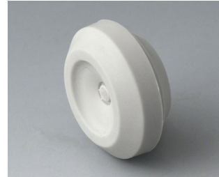
C2316147 Passe-câble TPE gris clair RAL 7035 IP 67