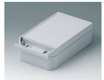
C6011201 SMART-BOX 110 LARGE ASA+PC (UL 94 V-0) gris clair RAL 7035 200x110x60mm IP 66