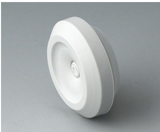
C2320147 Passe-câble TPE gris clair RAL 7035 IP 67