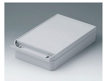
C6017281 SMART-BOX 170 LARGE ASA+PC (UL 94 V-0) gris clair RAL 7035 280x170x60mm IP 65