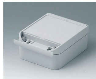
C6011141 SMART-BOX 110 LARGE ASA+PC (UL 94 V-0) gris clair RAL 7035 140x110x60mm IP 66