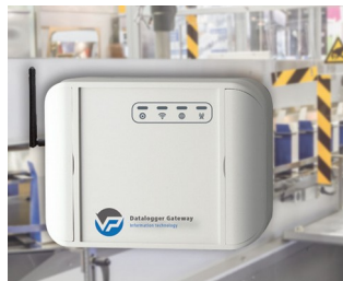
Enregistreur de données pour la surveillance des machines