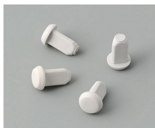
C2299018 Pieds de boîtier TPE (UL 94 HB)