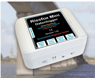
Enregistreur de données miniature pour données climatiques