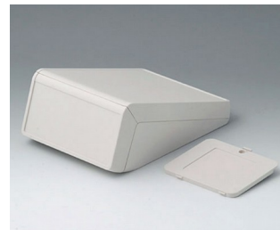
B4056327 UNITEC M, 1,4/0,6 ABS (UL 94 HB) gris blanc RAL 9002 148x210x80mm IP 40