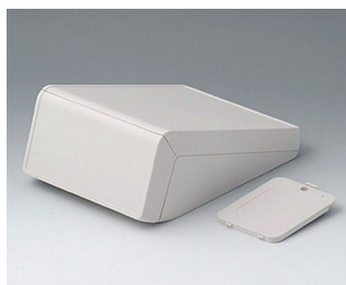
B4056207 UNITEC M, 0,6/0,6 ABS (UL 94 HB) gris blanc RAL 9002 148x210x80mm IP 40