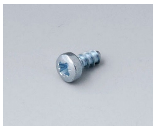
A0306031 Vis autotaraudeuses 3 x 6 mm (PZ1)