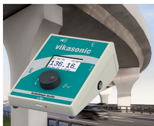
Appareil de mesure à ultrasons