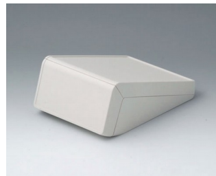
B4054137 UNITEC S, 0,6/1,4 ABS (UL 94 HB) gris blanc RAL 9002 125x177x69mm IP 40