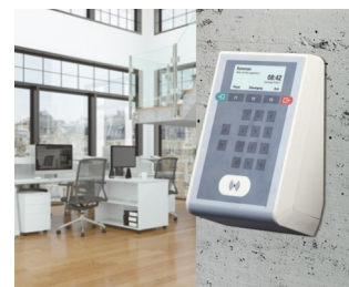
Terminal de badgeage