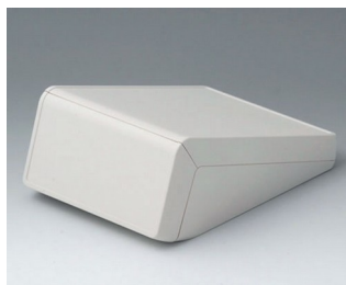
B4056107 UNITEC M, 0,6/0,6 ABS (UL 94 HB) gris blanc RAL 9002 148x210x80mm IP 40