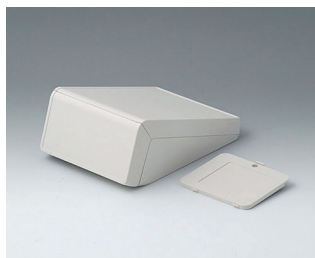
B4054307 UNITEC S, 0,6/0,6 ABS (UL 94 HB) gris blanc RAL 9002 125x177x69mm IP 40