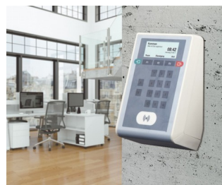
Terminal de badgeage