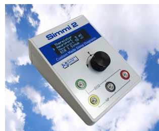
Simulateur de signal biologique