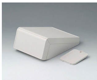
B4054207 UNITEC S, 0,6/0,6 ABS (UL 94 HB) gris blanc RAL 9002 125x177x69mm IP 40