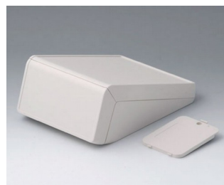
B4056237 UNITEC M, 0,6/1,4 ABS (UL 94 HB) gris blanc RAL 9002 148x210x80mm IP 40