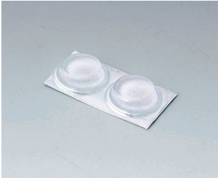
A9212330 Pieds anti-glissant 12 x 3,5 mm transparent

Sous réserve de modifications techniques. © OKW Gehäusesysteme, Buchen/Allemagne.