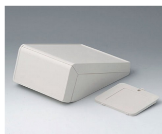
B4056337 UNITEC M, 0,6/1,4 ABS (UL 94 HB) gris blanc RAL 9002 148x210x80mm IP 40