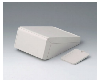
B4054237 UNITEC S, 0,6/1,4 ABS (UL 94 HB) gris blanc RAL 9002 125x177x69mm IP 40