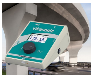
Appareil de mesure à ultrasons