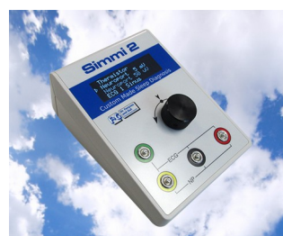
Simulateur de signal biologique