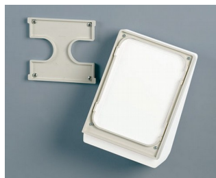
B4156307 Jeu de support mural M gris blanc RAL 9002