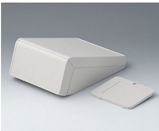
B4056307 UNITEC M, 0,6/0,6 ABS (UL 94 HB) gris blanc RAL 9002 148x210x80mm IP 40